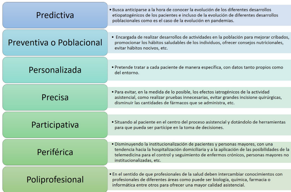
Figura 3 Marco de la Medicina 7P propuesto.

et al. 16 , en la detección de autismo 17 en niños. Se utiliza información sobre imágenes de resonancia magnética. Esta información es procesada por una Deep Neural Network 18 para, finalmente, utilizar una Support Vector Machine 19 que será la encargada de estimar, con una elevada fiabilidad, si el paciente padecerá o no autismo. El modelo ha sido validado con 179 patrones. La precisión ofrecida es de un 94%, la especificidad es del 88% y la sensibilidad es del 95%.