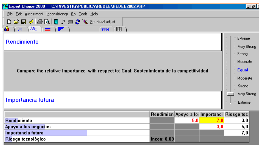
Ilustración 2. Expresión de juicios y construcción de la matriz de dominaciones

En primer lugar el decisor debe expresar sus preferencias en relación a los criterios, indicando en qué medida cree que un criterio es más importante que otro de cara al cumplimiento del objetivo de la decisión. Estas respuestas tienen carácter cualitativo ( fuertemente importante, ligeramente importante, etc.) aunque, inmediatamente, son codificadas una escala de uno a nueve (Tabla 2) por el coordinador del proceso o el software de aplicación. La Ilustración 2 recoge esta conversión: en la parte superior figuran la pregunta que se formularía al decisor y sus posibles respuestas, que son perceptuales; la parte inferior de la ventana muestra la transformación de las respuestas a escala numérica y su organización matricial, que no se presentan al decisor 24 .