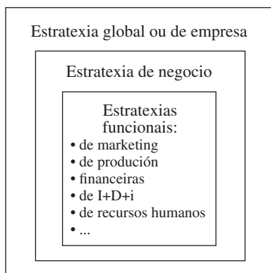
Ilustración 2: Os niveis de estratexia

Se o galego se fixese presente na determinación da misión , se formase parte do modelo de empresa a través da visión e se incorporase aos valores corporativos, resultaría altamente probábel que o galego se convertese na lingua visíbel da formulación dos obxectivos xerais, tácticos e operacionais e, seguindo coa coherencia, incorporalo ao esquema da estratexia nos seus tres niveis (Ilustración 2): global ou de empresa 1 , competitivo 2 e funcional 3 . Neste punto, xa se estaría nunha situación caracterizada pola presenza na lingua galega na reflexión de futuro da empresa (planificación, esencialmente) e na vida cotiá da organización (nos seus procesos, na súa política comercial –publicidade, forza de vendas, relacións públicas–, na súas comunicacións internas etc.).