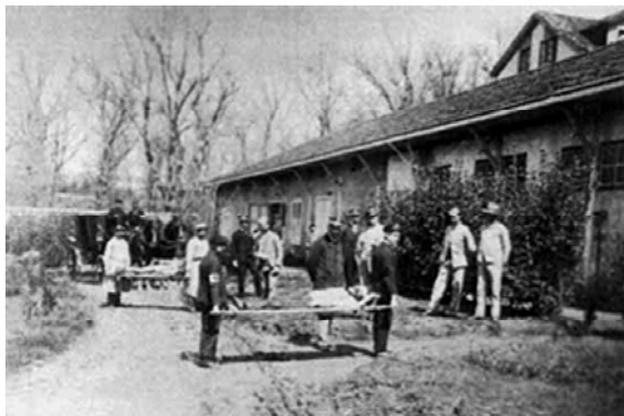
Foto 2: Repatriados da guerra de Cuba. Pedrosa, 1898. [ http://www.fundacionsbs.com/pdf/historia_caja_cantabria.pdf ]

tradicionais, provocando o abandono dos lazaretos. Neste estado atopábanse Oza e Pedrosa cando pouco antes de ser clausurados, serviron para acoller aos soldados enfermos e feridos, repatriados da guerra de Cuba 44 , que, ante o medo xeneralizado de que estendesen pola península as diversas enfermidades tropicais que portaban, sufriron corentena nos lazaretos de Oza, Pedrosa e San Simón, nunhas instalacións totalmente insalubres, tal e como mostra o testemuño do doutor Federico