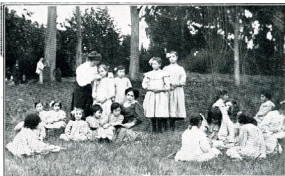
Foto 6: Clase de nenas e nenos ao aire libre coas súas mestras, en Notas santanderinas . - Un sanatorio. - un concurso.

ría posible sen o que o Dr. MORALES xulga como «o admirable labor» levado a cabo polo profesorado, que segundo parece deu mostras do “máis alto mérito e a proba máis relevante das súas condicións pedagóxicas e do celo con que se soubo levar a feliz termo obra de tanta responsabilidade e delicadeza (...). Satisfeita pode estar [a nosa Patria] de ter tales mestres e gratitudo débelle, pois en todo viuse claramente, e puideron observalo cantos visitaron o Sanatorio, o benéfico e rápido influxo da súa acción educadora, o mesmo en por menores, que a moitos podían parecer, sen celo, insignificantes, que naqueloutras cousas que todo o mundo estima de maior importancia 108 .”