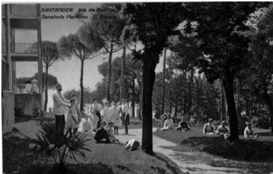
Foto 5: Sanatorio Marítimo Nacional de Pedrosa. Tarjeta Postal, s/f. [ http://www.numisjoya.com/Catalogos/PostalesEspaña5.htm ]

partida. [porque] É interesante que aprendan os nenos os múltiples detalles que ensina unha viaxe e a forma de comportarse no mesmo para gozar da maior comodidade posible co mínimo de molestia para as demais persoas 81 . "