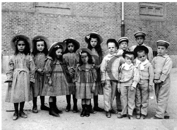
Foto 4: Colonia Infantil de Madrid a Santander. Nenas do asilo das Mercedes e nenos do Hospicio que foron por conta da Deputación ao Sanatorio de Pedrosa (Autor: Cifuentes. ABC, 25/8/1910)

ción previra que a tempada tiña que ter iniciado no mes de xuño.