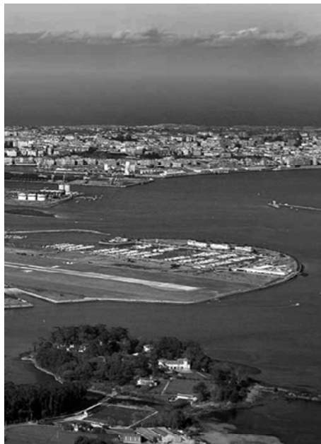
Foto 1: O Sanatorio na actualidade, coa cidade de Santander ao fondo.

A pesar das boas intencións, haberá que esperar ata 1869 para que comezase a funcionar o lazareto. Con todo, a finais do século XIX, os avances no coñecemento da transmisión de enfermidades -e con iso o tratamento e control das epidemias infecciosas-, a transformación e evolución da