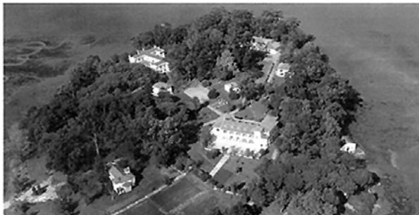
Foto 8: Vista aérea de Pedrosa na actualidade [ http://www.fundacionsbs.com/pag/localizacion.php?nome= ]

E o medio, máis que a represión, fixo raparigos dóciles e comedidos dos máis turbulentos, afinou os xeitos e corrixiu defectos que doutro xeito teñen difícil corrección. 122