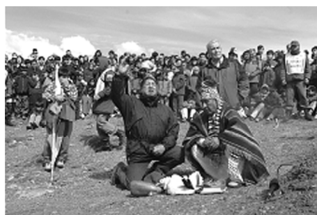
Foto 5. Cerimonia de liberación dun cóndor por representantes dos pobos orixenarios, na localidade de Río Turbio (Santa Cruz). Ano 2005

A Cunca Carbonífera conta cun enorme potencial de recursos naturais e socioculturais para o desenvolvemento de actividades ecoturísticas.