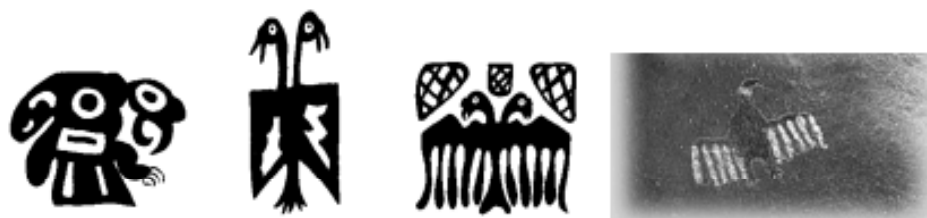
Ilustración 1: Representacións pictóricas do Cóndor Andino nas civilizacións pre-hispánicas

É unha ave estritamente carroñeira, posúe unha das taxas reprodutivas máis baixas do mundo e unha das maiores taxas de supervivencia entre as aves (LAMBERTUCCI, 2008). Segundo o seu estado de conservación, está catalogada como rara (GRIGERA e ÚBEDA, 1997) e Próxima á ameaza (BIRDLIFE