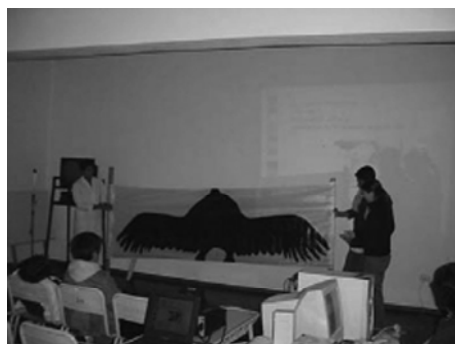
Foto 3. Involucrando aos nenos na proposta: Realización de Campañas educativas nas escolas. Participaron aproximadamente 1000 alumnos pertencentes a 14 escolas da rexión