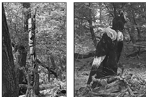
Foto 1. Fomento das actividades recreativo-turísticas: Esculturas do Sendeiro "Bosque dos Trasgos", realizadas por artesáns da rexión patagónica mediante a utilización de árbores mortas en pé.

Paralelamente, desenvolveuse unha campaña de educación ambiental denominada Os cóndores da conca, unha reserva para