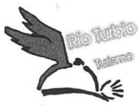
Ilustración 2. Escudo da Dirección de Turismo da localidade de Río Turbio