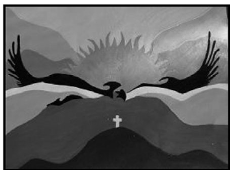
Ilustración 3. Escudo da Dirección de Turismo da localidade de 28 de Novembro

Esta liberación foi moi significativa, xa que foi precedida dunha cerimonia que