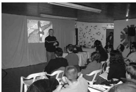
Foto 2. Fortalecemento das capacidades locais: Cursos de Capacitación, a partir dos cales habilitáronse “Guías de Sitio” nas localidades de Río Turbio e 28 de Novembro

Un factor importante foi a utilización dos medios de difusión masivos. Desde o inicio do proxecto divulgáronse as diferentes actividades realizadas, participando en diver-