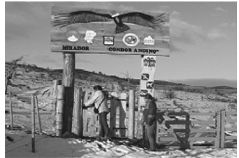
Foto 4 e 5. Inauguración do Carreiro “Miradoiro do Cóndor” na localidade de 28 de Novembro (Santa Cruz) e portal de ingreso