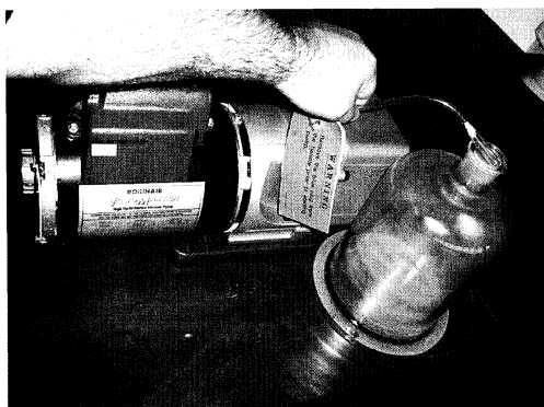
Figura 3. Dispositivo para aspirar e reter a fase particulada do fumo ambiental do cigarro

Acender um cigarro no interior de uma campânula e aspirar o fumo com uma boquilha (onde se colocou uma porção de algodão) ligada a uma bomba de vácuo, conforme se pretende mostrar na figura 3.