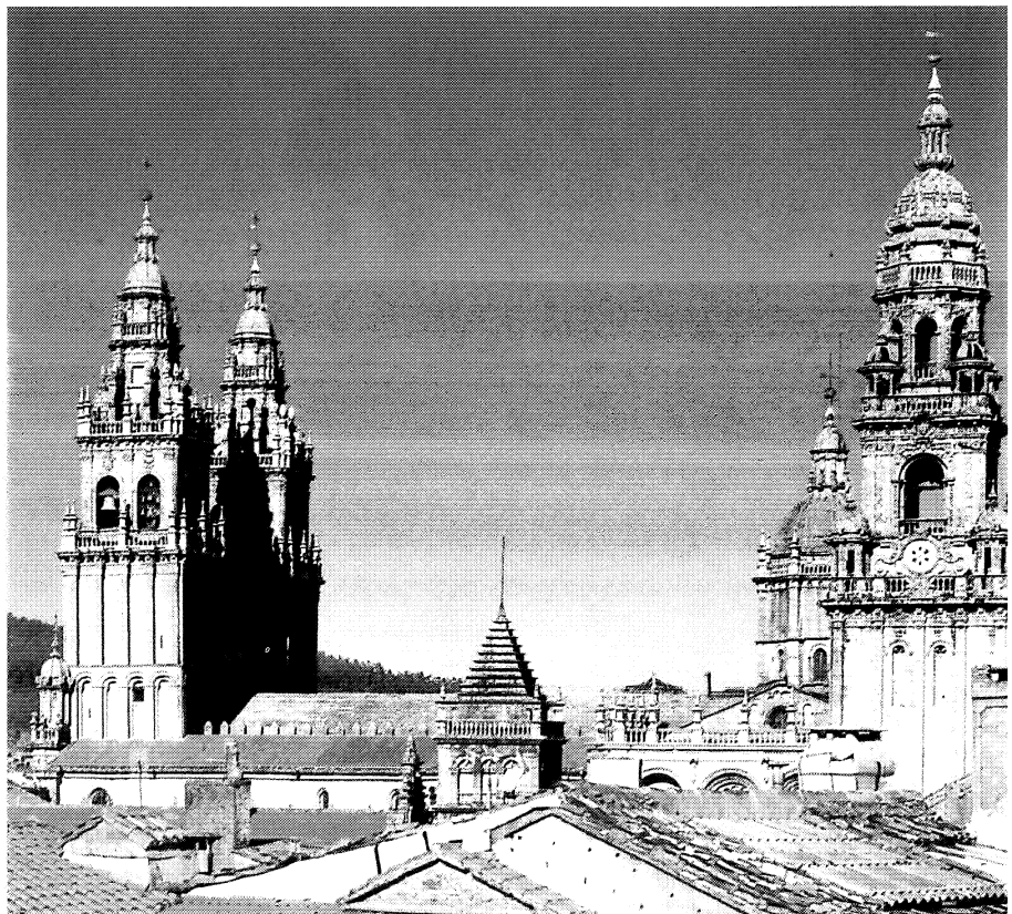
Vista del conjunto de las torres de la Catedral de Santiago de Compostela