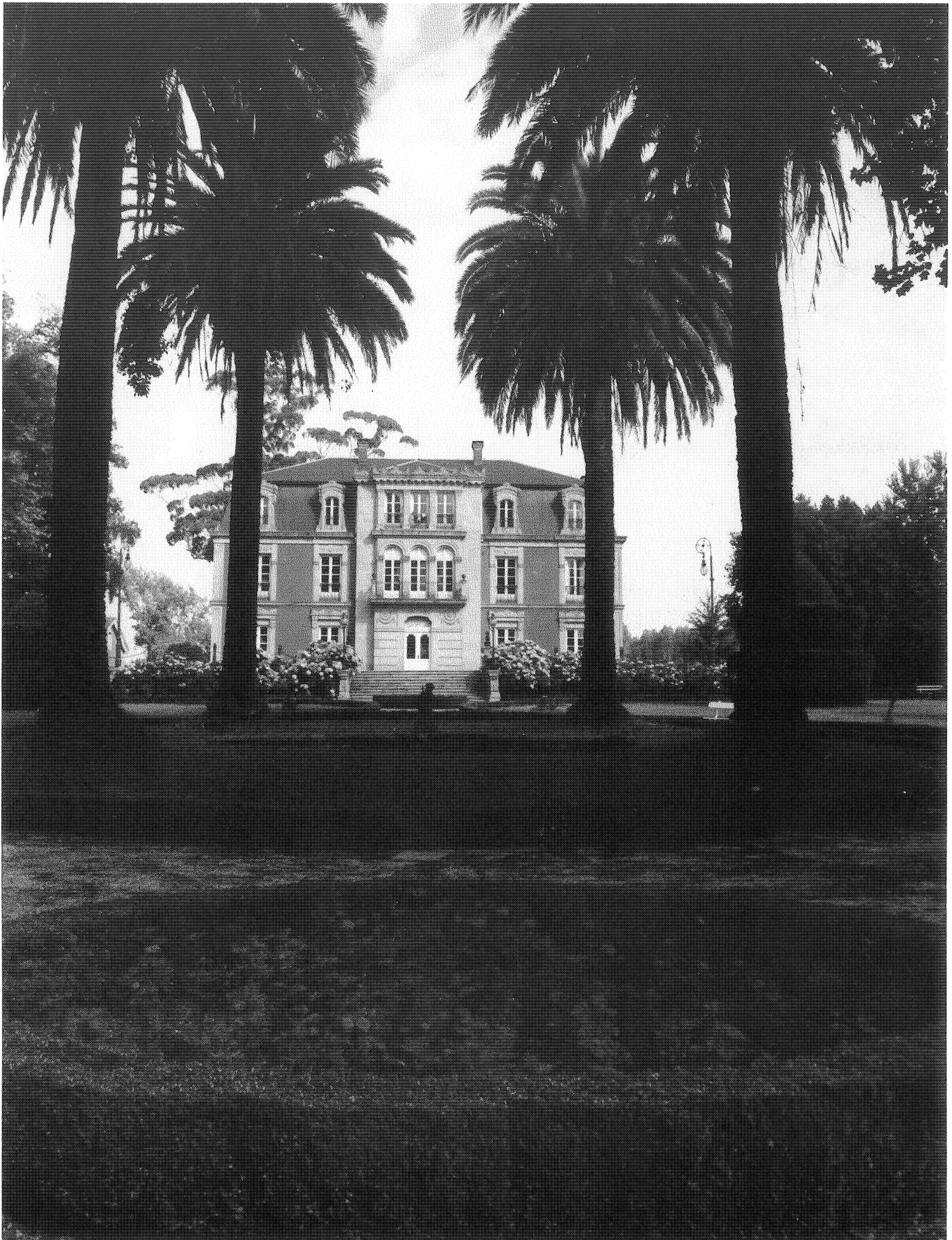
Fig. 1.—A PARTE GRÁFICA DA TESE ESTÁ INTEGRADA POR 275 CUIDADOS DEBUXOS, REALIZADOS CUNHA CALIDADE E TRABALLO NON MOI CÓRRENTES.