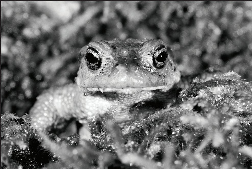
“A gatas por Galicia”