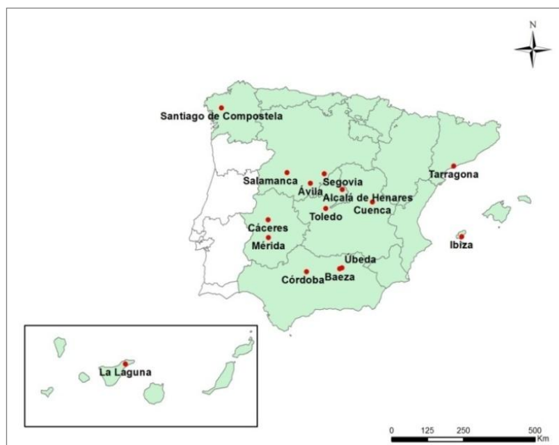
Figura 2. Ciudades Patrimonio de la Humanidad de España

En algunos destinos como España sí que se aprecia una correspondencia entre el número de ciudades Patrimonio de la Humanidad y el de observatorios turísticos. De este modo, algunas de las ciudades patrimoniales españolas (Figura 2) han creado observatorios turísticos, entre ellas: Córdoba, Ávila, Tarragona, Cuenca, Santiago de Compostela, Ibiza, Salamanca, Toledo y Segovia. A su vez, el Grupo de Ciudades Patrimonio de la Humanidad de España (GCPHE) creó un observatorio conjunto. El mismo elabora y publica anualmente un boletín de coyuntura turística, en el que se analizan los principales indicadores turísticos de las ciudades en conjunto, y de forma individual (Troitiño et al., 2009).