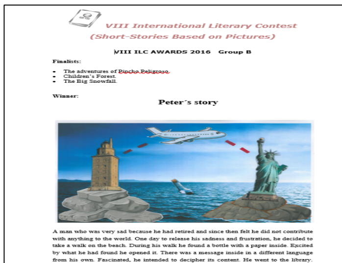
Figura 4. Ejemplo realizado por una alumna.

Por otra parte, en la materia de DLE presentamos el Portafolio Europeo de Lenguas como recurso para que el alumnado tome consciencia de su propio proceso de enseñanza y aprendizaje. Animamos a que todos creen su propio portafolio, con las tres partes que indica el Consejo de Europa: Pasaporte, Biografía y Dossier. Es en este último en el que incorporan, como una muestra más de sus trabajos, tanto si han resultado ganadores como si no, su aportación original. De este modo se sienten incentivados, aunque no ganen porque su esfuerzo se ve también recompensado. Además, les sirve como ejemplo para que después ellos mismos puedan llevar a cabo este tipo de actividades con sus futuros alumnos en las escuelas de Educación Primaria.