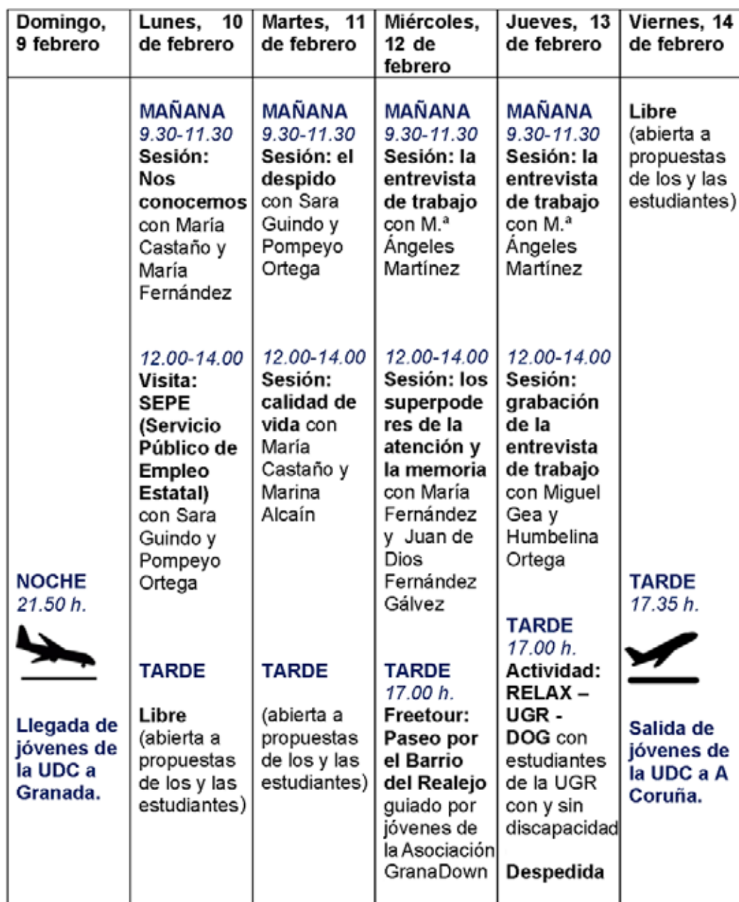
Figura 1. Programa de actividades realizado en la visita a la UGR