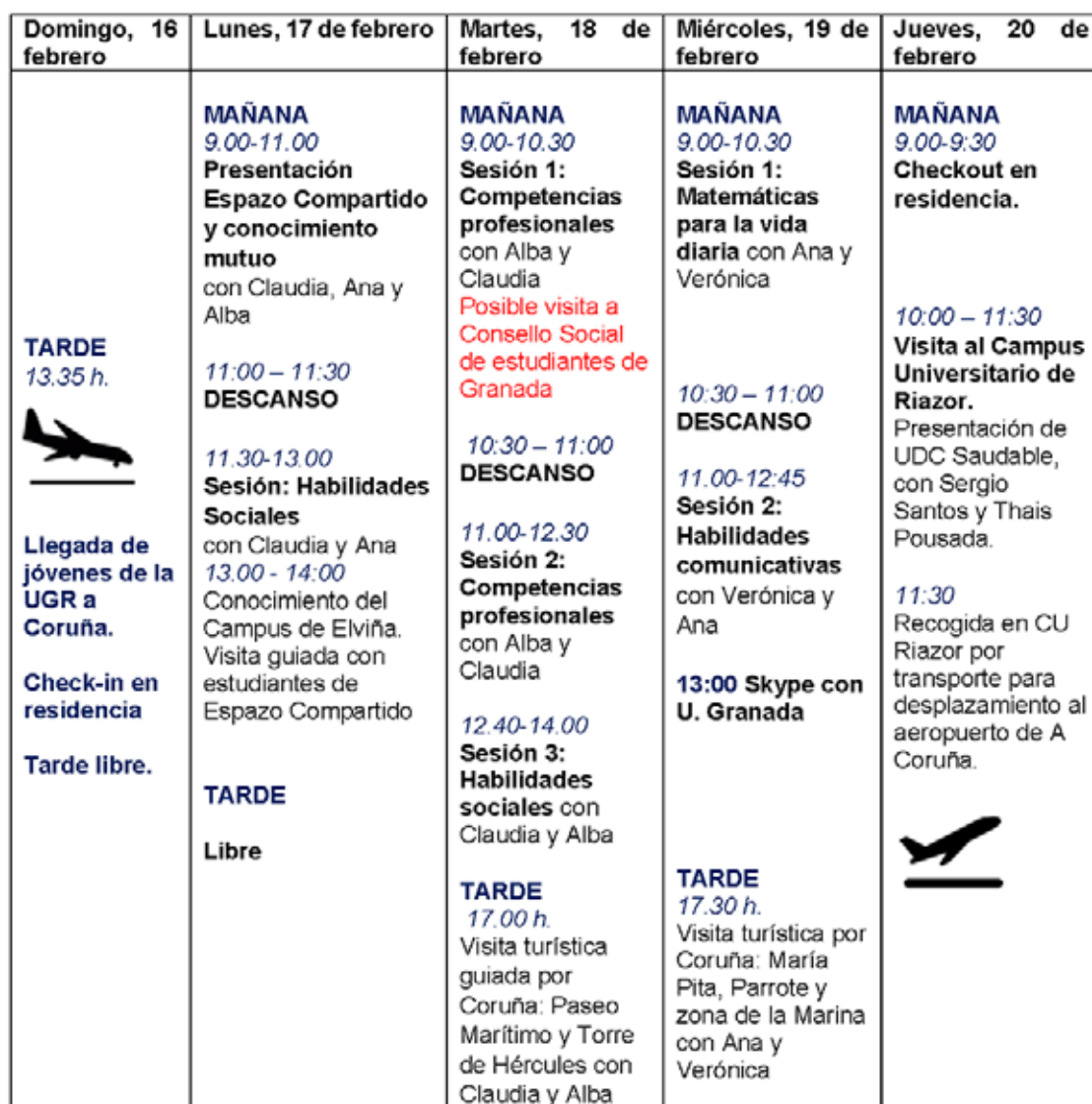
Figura 2. Programa de actividades en la Universidade da Coruña

La experiencia resultó motivante, interesante y muy beneficiosa para todas las partes implicadas, por lo que se decidió continuar con la propuesta y programar para el siguiente curso un encuentro de similares características.