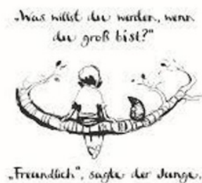
(d) Traducción al alemán.