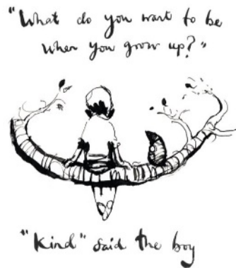
(a) Traducción al inglés.