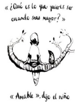
(b) Traducción al español.