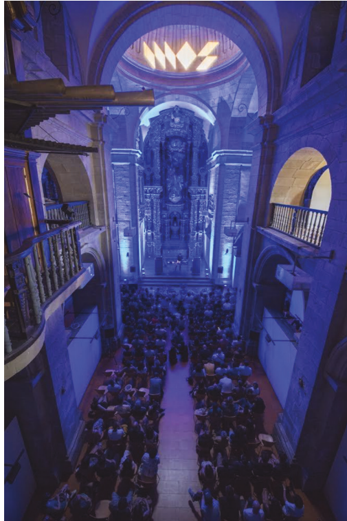
Fotografía 2. Concierto realizado en el festival WOS Festival x Son Estrella Galicia