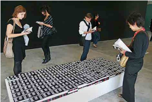
Figura 1: Dora García, Roba este libro, bienal de Lyon