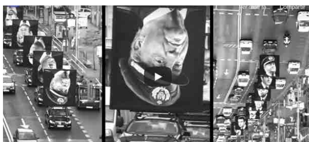
Figura 4: Santiago Sierra y Jorge Galindo, Los encargados , Gran Vía de Madrid. Enlace a video: https://youtu.be/QLIF0mwJe_I , consultado el 9/07/2022