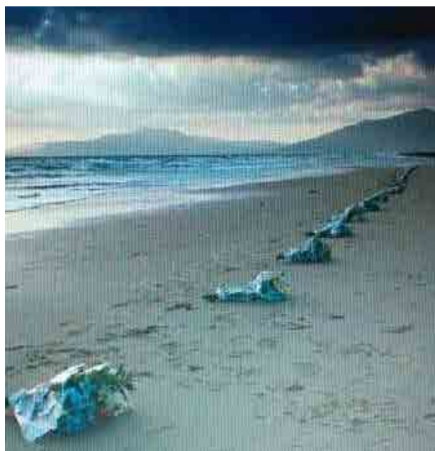
Figura 3: Jesús Rodríguez, Inmigrantes , La Rábida, 2001