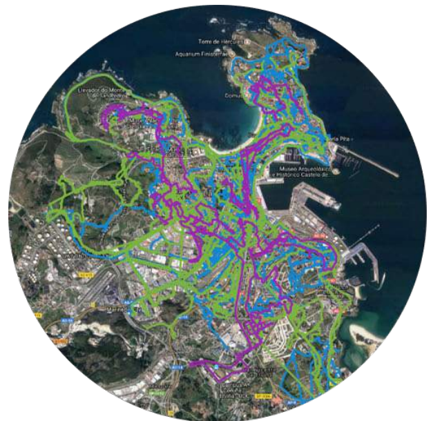
Imaxe 1. Tracks das derivas pola cidade.