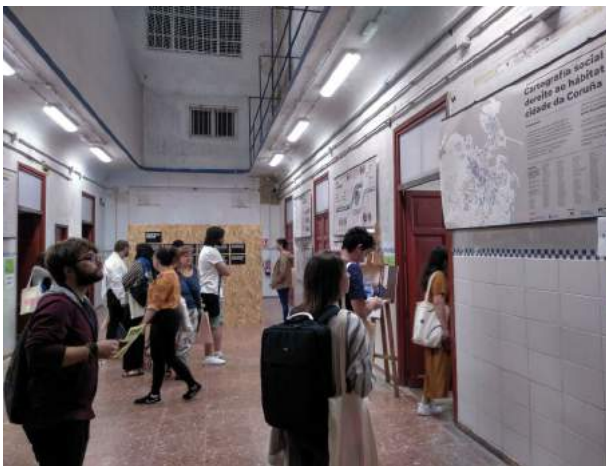
Imaxe 6: Cárcere Vello, A Coruña.