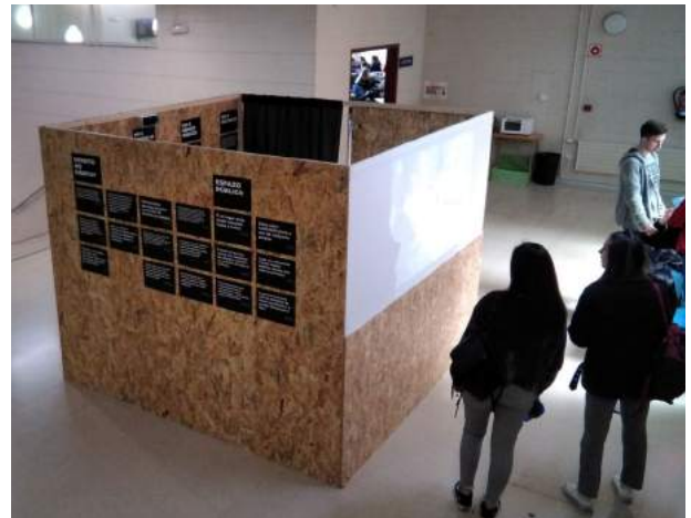
Imaxe 5: Habitáculo das voces de persoas sen fogar e profesionais.