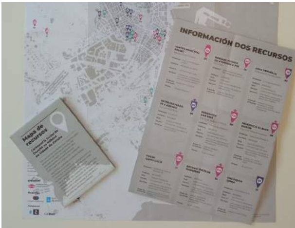
Imaxe 4: Mapa de recursos para persoas sen fogar.