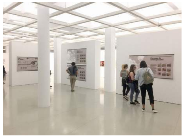
Imaxe 7: Escola Técnica Superior de Arquitectura (UDC).

Un grupo reducido de persoas voluntarias, tanto de grao como de mestrado, participou na preparación e inauguración da exposición. Como se pode apreciar nas imaxes, circulou por diferentes lugares, amosando a magnitude da exclusión residencial na cidade da Coruña, que non se pode reducir á súa cara máis visible, senón que é preciso cifrar o problema desde unha óptica ampla, para tomar conciencia e esixir políticas sociais e de vivenda acordes cun problema de amplo alcance.