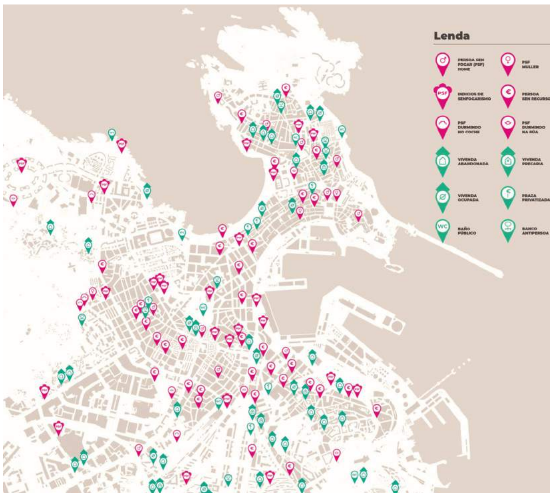
Imaxe 3. Panel de localización de hábitat e espazo público (cor verde) e senfogarismo (cor fuxia).

específicos (de inclusión e de erradicación do chabolismo); dous comedores sociais; un servizo de emerxencias (SEMUS); e catro unidades de rúa. Recursos, en xeral, profesionalizados e con diversidade de áreas de actuación, non só asistencial. Aínda así, os axentes chave entrevistados botan en falta recursos de baixa esixencia (con requisitos menos estritos, por exemplo, poder levar mascota) e para problemas de saúde mental, así como pisos de autonomía.