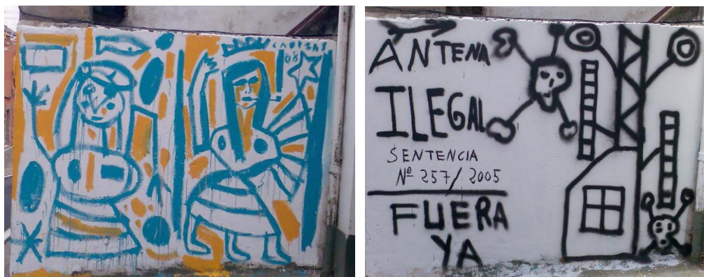
Figs. 2 y 3. Mural de Jorge Cabezas (izquierda) y pintada que lo sustituyó (derecha).

Además del objetivo puramente estético, esta intervención individual en el paisaje urbano conlleva implícita una denuncia acerca del estado de abandono del vecindario. A esa primera Menina enseguida se le unió un mural, contribución del pintor coruñés Jorge Cabezas, que al poco tiempo fue tapado por una pintada anónima de carácter reivindicativo (véanse Figs. 2 y 3).