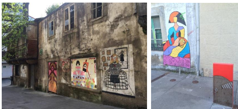
Figs. 4-5. Murales y mobiliario urbano inspirados en “Las Meninas”

Hasta la fecha se han llevado a cabo un total de siete ediciones, ya que en los años 2011 y 2012 no se pudieron celebrar por diferentes motivos. Cada año el número de pintores/as y artistas que acuden a la cita va en aumento, así como los/as vecinos/as que ceden sus fachadas para la elaboración de nuevos murales. Cabe destacar que “Las Meninas” no se limitan únicamente a la pintura, sino que engloban otras actividades artísticas. Por ejemplo, durante los días en que se celebran se realizan actividades de todo tipo: talleres para la infancia y para adultos, conciertos, representaciones teatrales, proyecciones audiovisuales, etc.