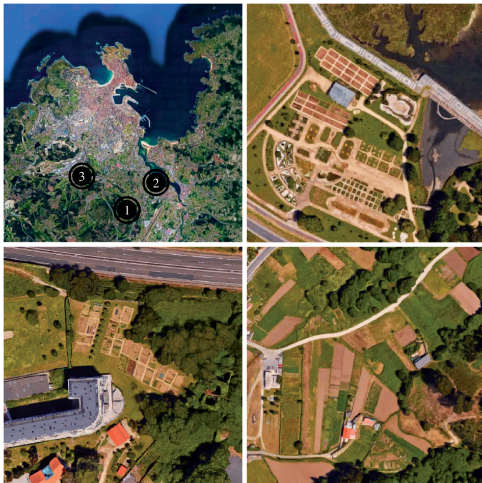
Figura 2. Localización y fotografías aéreas de los huertos estudiados.

NOTA. De izquierda a derecha y de arriba abajo: Localización de los huertos; (1) huerto municipal de Culleredo-O Burgo; (2) huerto municipal de Culleredo-Villa Melania; (3) huerto de Feáns.