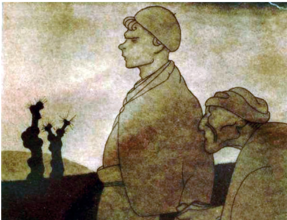
Imagen 1. Castelao retrata el drama de la emigración, que llega a nuestros días:

«¿Para qué quieres irte de la Tierra? ¿No tenemos pan en el horno?»