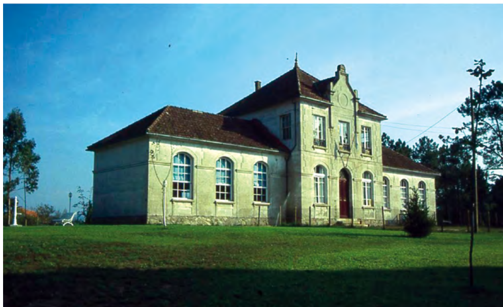
Imagen 4. Escuela «Aurora del Porvenir» en Tomiño (Pontevedra), sostenida por emigrantes gallegos residentes en el Brasil y la Argentina, donde el maestro ejerció entre 1931 y 1936

El labriego emigrará de Galicia mientras la campiña gallega no sea objeto de mayor atención por parte de quien sea capaz de resolver el problema. A tal extremo ha llegado la división de la propiedad y tales los impuestos que pagan, que cada parcela de tierra que el labriego adquiere no es más que un eslabón que agrega a su cadena de esclavo. 72