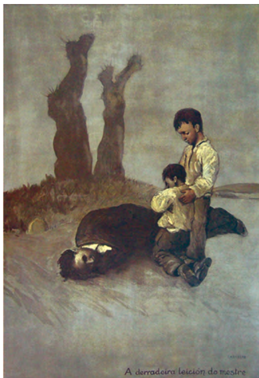
Imagen 6. «A derradeira lección do mestre». 1937. © Editorial Galaxia y herederos de Castelao. Óleo sobre tela pintado en 1945, ya en el exilio, expuesto en el Centro Galicia (Buenos Aires), en el que Castelao retrata la salvaje represión fascista contra el magisterio republicano. La víctima representa a Alexandre Bóveda, maestro y compañero político de Alonso Ríos en el Partido Galeguista, asesinado en Poio (Pontevedra), en agosto de 1936