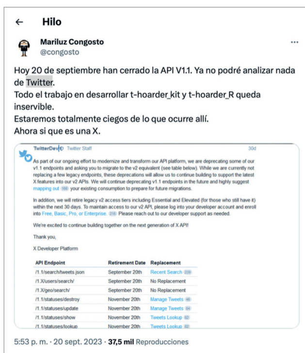
Figuras 2 y 3. Reacciones ante el cierre definitivo de la API académica y la V1.1. @SMLabTO y @congosto.