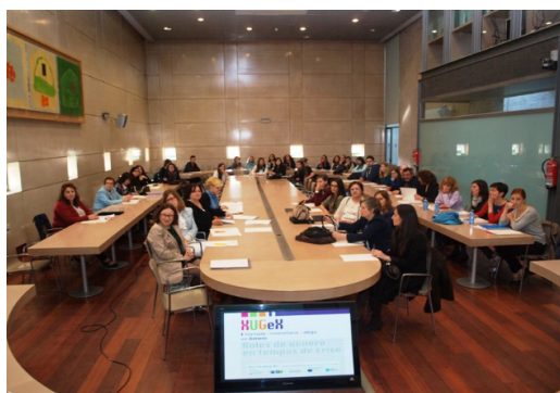
Primera Xornada Universitaria Galega en Xénero. 2013.