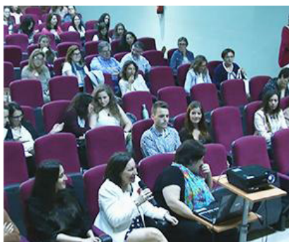
Tercera Xornada Universitaria Galega en Xénero, 2015. Turno de preguntas.