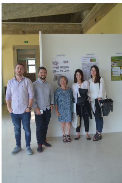
Segunda Xornada Universitaria Galega en Xénero, 2014. Sesión póster.

Tras esta primera etapa de recorrido por las tres universidades gallegas, centrada en la investigación en género realizada en el ámbito de Galicia, en el 2016 comenzó una segunda etapa de reflexión sobre la necesaria incorporación de la perspectiva de género en la docencia universitaria. Otra novedad de esta cuarta edición fue la apertura de la convocatoria a personal docente investigador de fuera del Sistema Universitario Gallego. Como se recoge en las actas de la Jornada (Aguayo, López y González, 2016), esta cuarta edición de la XUGeX permitió hacer balance del camino recorrido y de los grandes retos pendientes así como compartir algunos de los logros en la integración del enfoque de género en disciplinas de diversos campos como la economía, la filología, las ciencias de la educación, la física, la química o la astronomía. Y es que el desarrollo de las titulaciones universitarias, en el marco del Espacio Europeo de Educación Superior supone, no solo la orientación hacia nuevas metodologías de enseñanza-aprendizaje, sino también la incorporación de forma transversal de enfoques como la perspectiva de género en las distintas disciplinas.