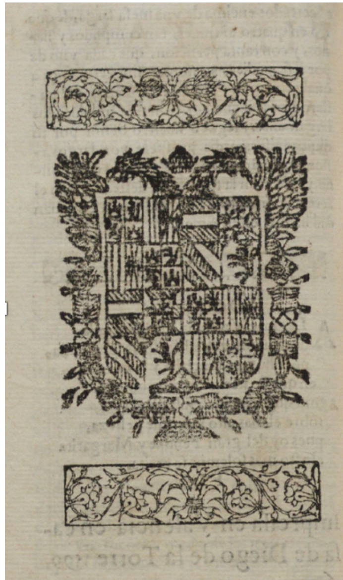
Ilustración 3. Escudo xil. en la Relación de la solemne entrada... (noticia núm. 17) [Real Biblioteca del Monasterio de San Lorenzo de El Escorial, sign. 103-V-13(3) ©Patrimonio Nacional]

De las 28 noticias (incluyendo las dos de 1598), 12 se imprimieron en Valencia, en los talleres de Patricio Mey, Juan Crisóstomo Gárriz y Diego de la