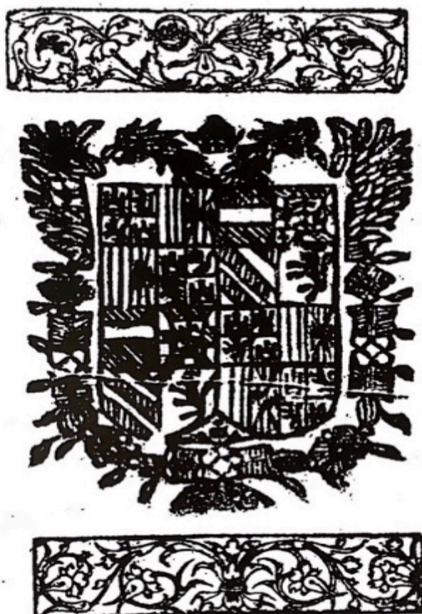
Ilustración 2. Escudo xil. en la Relación de la solemne entrada... (noticia núm. 15) (Biblioteca Nazionale Centrale Vittorio Emanuele II, sign. BVEE/046122)

rrer de Caualleros', noticia núm. 17. Asimismo, podemos comprobar que el grabado final es idéntico: