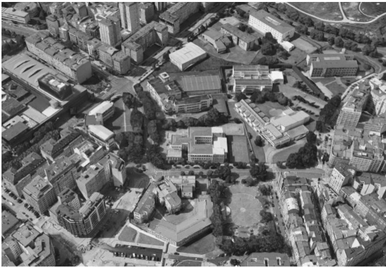
Escuela de Magisterio e Instituto de Enseñanzas Medias Escuela de Comercio y Escuela de Náutica Ciudad Escolar: vista aérea actual