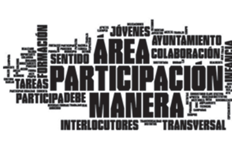
FIGURA 1. Cómo hacer participación y quién participa

El verdadero éxito de los programas radica en la coparticipación. Para ello hay diversas áreas que son especialmente significativas, abiertas a sugerencias, propuestas de cambio y mejora en asuntos vinculados a NNyA (véase figura 1). También hacen una gran labor el Consejo Escolar y el de la Juventud.