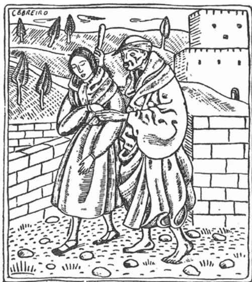
Deseño de Álvaro Cebreiro para o prólogo d'O Mariscal.

Certamente, o primeiro que cómpre sinalar é que se trataba apenas do prólogo da obra dramática, un breve fragmento de setenta e nove versos en que interveñen «un vello cego de romances, co'a zanfona, e unha mociña loira que o guía» (Cabanillas; Villar Ponte 1926: 11), dúas figuras alleas á trama principal que serven de marco introdutorio á trágica acción. Fican fóra desta introdución personaxes como A Raza ou o propio Mariscal e unicamente se anuncia unha «negra hestoria» derivada dunha «treición» sen concretizar —aínda que a felonía foi «feita por certos estamentos (xerarquía eclesiástica, nobreza entreguista, servos cobizosos)» (Ínsua 2005: 223), tal como se desenvolverá ao longo dos tres actos.