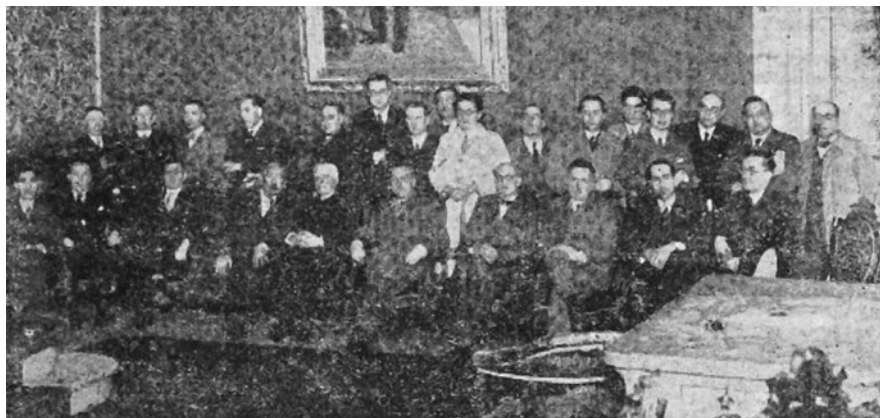
Asemblea constitutiva da Asociación de Escritores de Galicia en Compostela (IG 31-03-1936: 1)