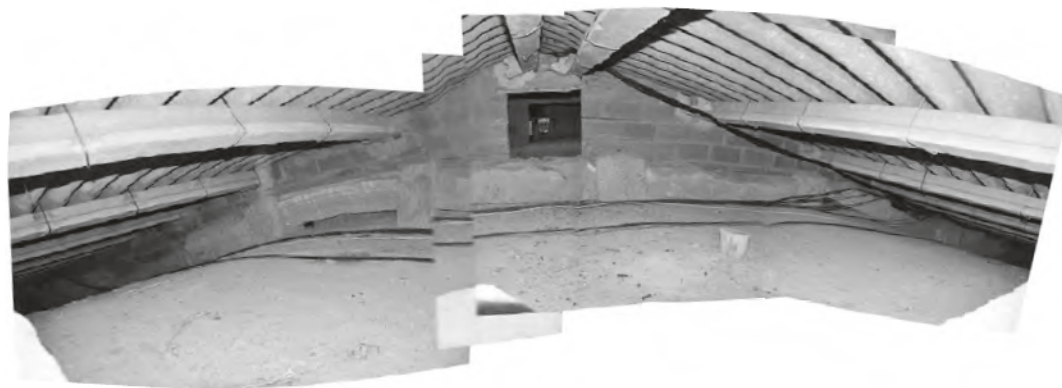
Figura 5 Arcos resaltados del trasdós de la bóveda de la nave de la iglesia

capa de hormigón impide asegurarlo sin ningún tipo de dudas, parece un sistema de arcos con dos rosas independientes —en casos separadas— y sólo conectadas en las claves-cruceiros.