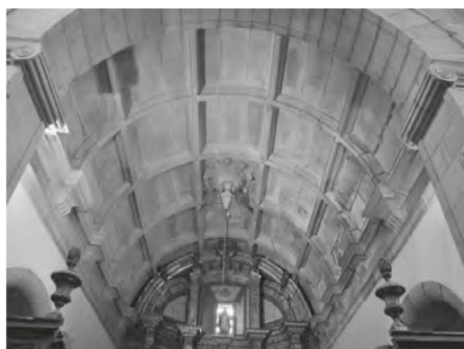
Figura 2 Bóveda de la capilla de Santa Escolástica

Las bóvedas arrancan de cornisas quebradas sobre ménsulas coincidentes con el arranque de los arcos transversales rematadas inferiormente por una moldura corrida, y son soportadas por los muros laterales