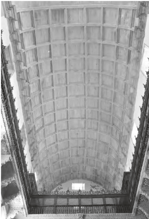
Figura 4 Bóveda de la nave de la iglesia

La iglesia presenta una nave muy alta, con capillas laterales muy bajas, por lo que históricamente el con-