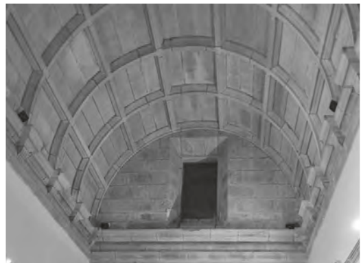
Figura 3 Bóveda del Oratorio de San Felipe Neri

Existen algunas diferencias entre ambas estancias: el Oratorio se cierra con sendas arquerías con fondo ciego en los lados largos, mientras que en la Statio se hace con muros; en ésta se abrieron dos huecos a la fachada al patio de las bodegas (o de los Cerdos) que interrumpieron la cornisa, y que permiten comprobar que la plementería de esta fila de casetones de arranque se construye como parte del muro. Existe un tercer hueco que sólo afecta a la plementería y cuya misión podría ser dar ventilación a una de las estancias perdidas que originó la construcción de la nueva sacristía.