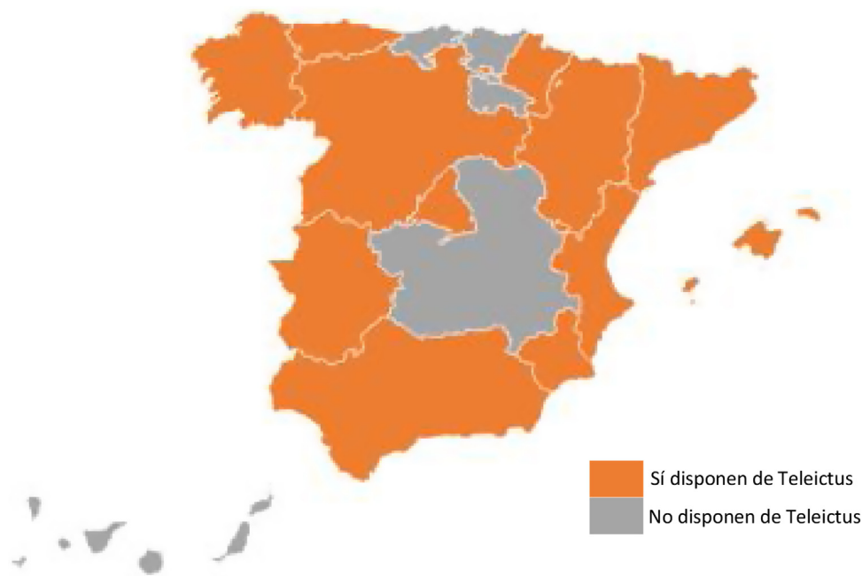
Figura 1 Resumen de la disponibilidad de sistemas de Teleictus.

transporte, se podrían evaluar estrategias que permitan una coordinación óptima entre los distintos niveles asistenciales, de manera que se minimicen los tiempos de respuesta y los recursos utilizados y se mejoren los resultados clínicos. Finalmente, los estudios de economía de la salud en el contexto del Teleictus podrían proporcionar información valiosa sobre la rentabilidad y eficiencia en la asignación de recursos, asistiendo a los responsables de la toma de decisiones en la implementación y expansión de estos programas.