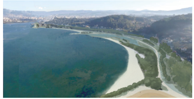
Vista aérea desde o suroeste antes da proposta e segundo a proposta · APDR, Lukas Santiago

truturas. O Porto de Marín é un porto do Estado con acceso directo á autoestrada AP-9 a través da autovía estatal PO-11 e tamén conta cunha conexión ferroviaria directa ao corredor Coruña-Vigo. Os fluxos de tráfico superan os 20.000 vehículos ao día na autovía, fronte aos 5.000 do tramo da vía autonómica que discorre polo interior (PO-546). Polo tanto, calquera proposta viable debe ter en conta a necesaria conectividade do porto. As propias vías de comunicación causaron un gran impacto nos núcleos de poboación, especialmente nos Praceres, que foi atravesada pola autovía, que discorre a escasos 5 metros da igrexa. Ademais, a vía do tren atravesaba a praza principal do núcleo.