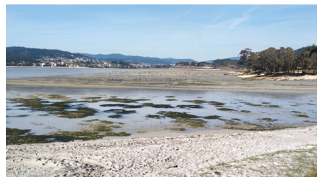
Vista actual desde a pasarela peonil dos Praceres e vista segundo a proposta · Jorge Rodríguez