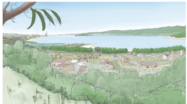
Vista actual desde o Monte do Sino, nos xardíns do Pazo de Lourizán, e vista segundo a proposta · Jorge Rodríguez

A presenza da fábrica de Ence na ría de Pontevedra é un vestixio dun paradigma industrial obsoleto, centralista e autoritario, baseado na negligencia ambiental e o desprezo pola comunidade local. A construción da fábrica de pasta de papel Celulosas, entre os anos 1958 e 1963, non só sepultou o banco marisqueiro máis produtivo da ría, senón que tamén botou a perder unha incipiente actividade turística nunha contorna privilexiada, que mesmo Otero Pedrayo describira coma unha "síntese admirable da Paisaxe Galega" 1 . A oposición local á fábrica iniciárona as mariscadoras, que sufriron a perda do seu sustento coas obras de recheo. Unha forte represión silenciou as protestas durante a ditadura, malia os evidentes impactos negativos da actividade da Celulosa na contorna, caracterizados polo seu cheiro, pero tamén polos vertidos na ría e a súa influencia na propagación do monocultivo de eucalipto en toda Galicia 2 . A oposición á fábrica retomou visibilidade coa chegada da democracia, a través de asociacións ecoloxistas, destacando a Asociación Pola Defensa da Ría (APDR), que desde 1987 vén desenvolvendo numerosas accións de concienciación e estudos para esixir o traslado da fábrica fóra da ría.