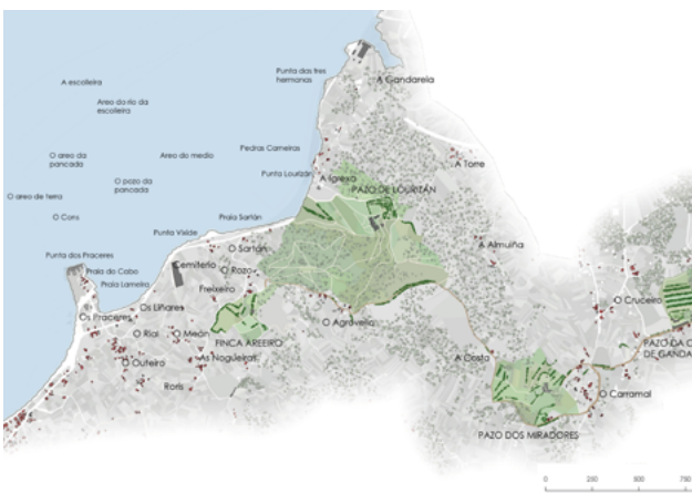
Reconstitución do litoral de Lourizán antes do recheo e implantación da fábrica, toponimia e relación entre os seus núcleos e pazos · Jorge Rodríguez