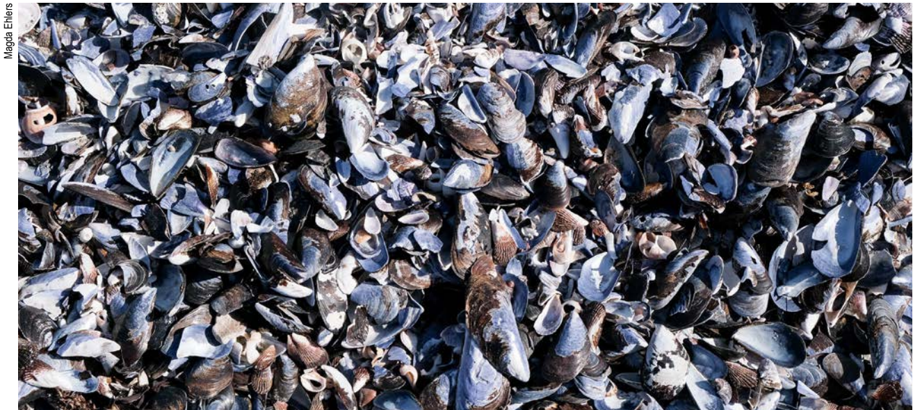
Cunchas de mexillóns.

Proxecto Biovalvo, desenvolvido polo Grupo de Construcción da Universidade da Coruña (UDC) e coa participación de diversas empresas, incluíu entre os seus obxectivos a aplicación das cunchas de mexillón como biomaterial de construción para o seu uso en diferentes aplicacións, sexa como áridos para a fabricación de formigóns en masa ou para morteiros de revestimento, sexa como material de recheo solto para illamento térmico e acústico. Este artigo amosa un breve resumo da investigación levada a cabo, xa defendida como tese de doutoramento na UDC. Conclúese que é viable e de grande interese utilizar a cuncha de mexillón nestas aplicacións, podendo substituír entre o 12 e o 50% dos áridos convencionais en formigóns e morteiros e completamente no caso dun material illante.