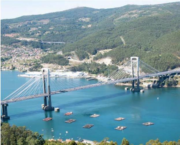
Bateas situadas ao lado da ponte de Rande.

cm 2 , é dicir, 10,2 kg de peso por cm 2 ) sen modificar a súa granulometría de maneira significativa. Para colocar correctamente o material como recheo solto illante, recoméndase un índice de compactación maior ao 30%, o cal permite evitar asentos que poidan provocar pontes fónicas ou térmicas non desexables.