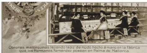
Obreras mallorquinas teñendo lapis de nudo hecho a mano en la fábrica que los Hermanos Fernández poseen en Palma de Mallorca.