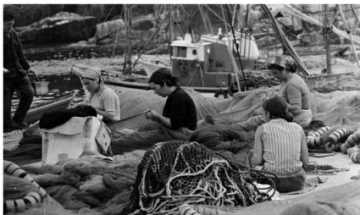
Mulleres redetas.