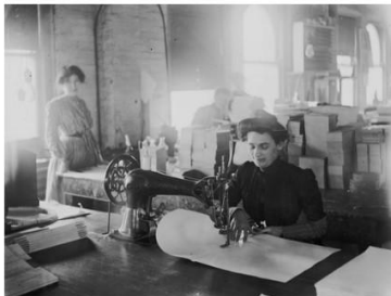
Mujeres trabajadoras de una fábrica textil en Detroit cosen con máquinas 'Singer'.