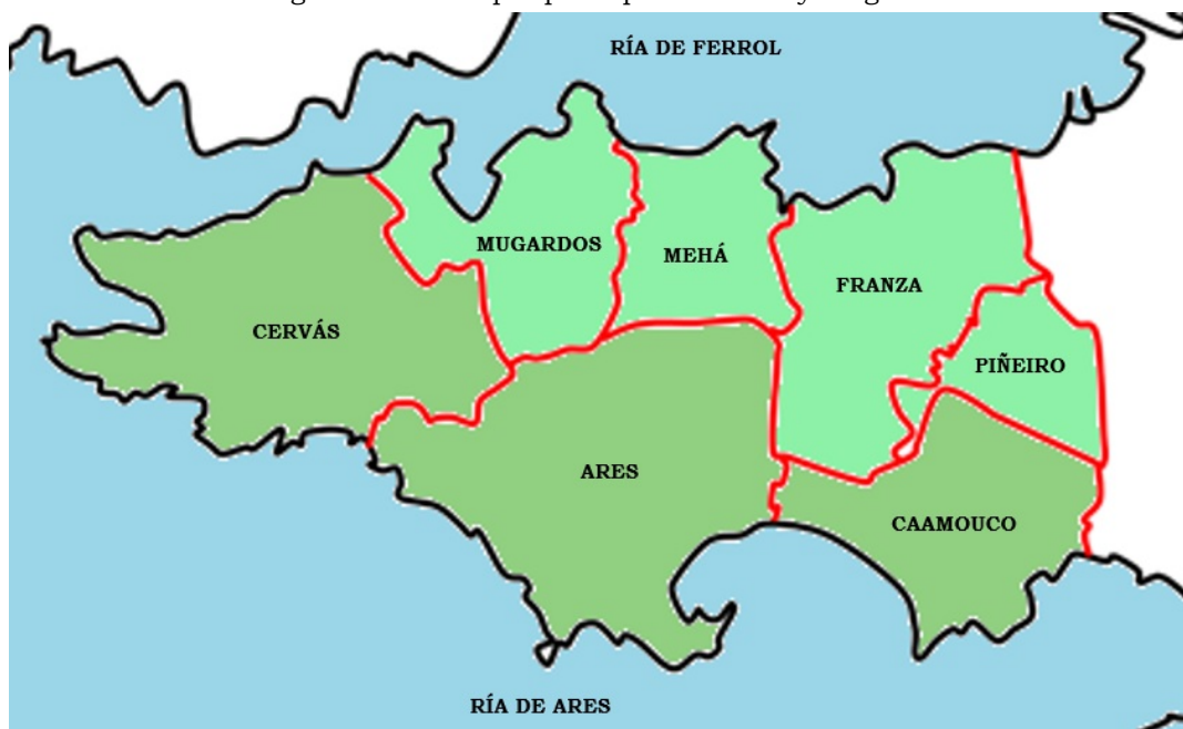
Imagen 3. División por parroquias de Ares y Mugardos.