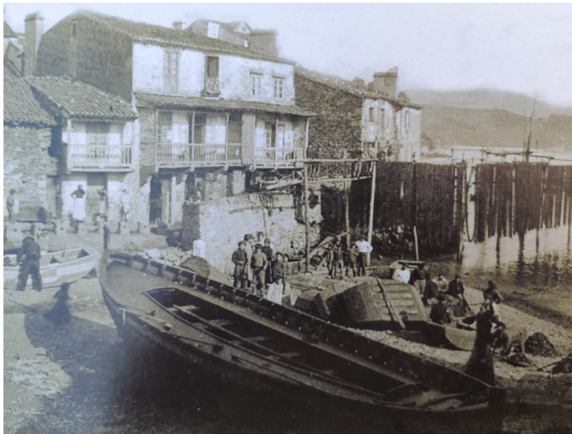
Imagen 4. Redes con las redes “de xeito” en las cabrias (1910).