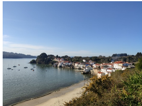
Imagen 6. Puerto de Redes.