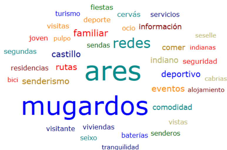
Imagen 9. Nube de palabras Atlas.ti.

En este primer punto, se aborda el análisis de la oferta y la demanda turística actual y potencial de Ares y Mugardos en base a la percepción de los agentes sociales entrevistados (véase imagen 9). Para ello y para realizar una mejor lectura de las entrevistas se establecieron cuatro dimensiones: oferta turística, donde se analizan los acontecimientos programados (N=4), la cultura (N=19), la gastronomía (N=19) y la infraestructura turística (N=30); el perfil del turista, donde se observa el perfil sociodemográfico (N=35), la tranquilidad (N=19), el trato recibido (N=5) y la accesibilidad (N=10); el turismo náutico, donde se incluyen los senderos litorales (N=32) y las actividades náuticas (N=11) y el turismo marinero, donde se analiza la naturaleza (N=22) y la cultura marinera (N=15).