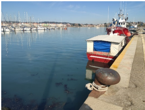
Imagen 5. Puerto de Ares.