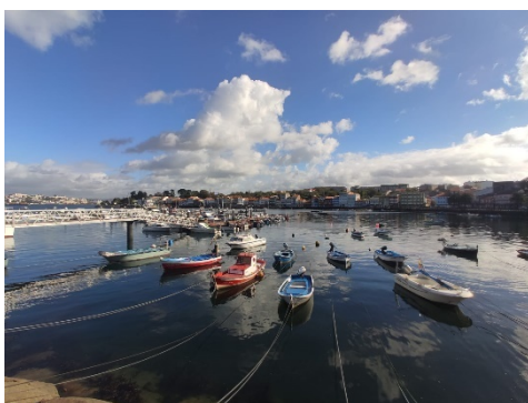
Imagen 7. Puerto de Mugardos.