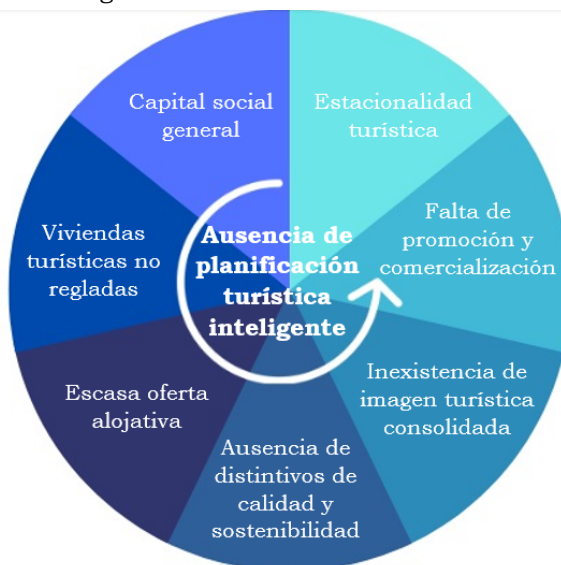
Imagen 10. Problemáticas identificadas.