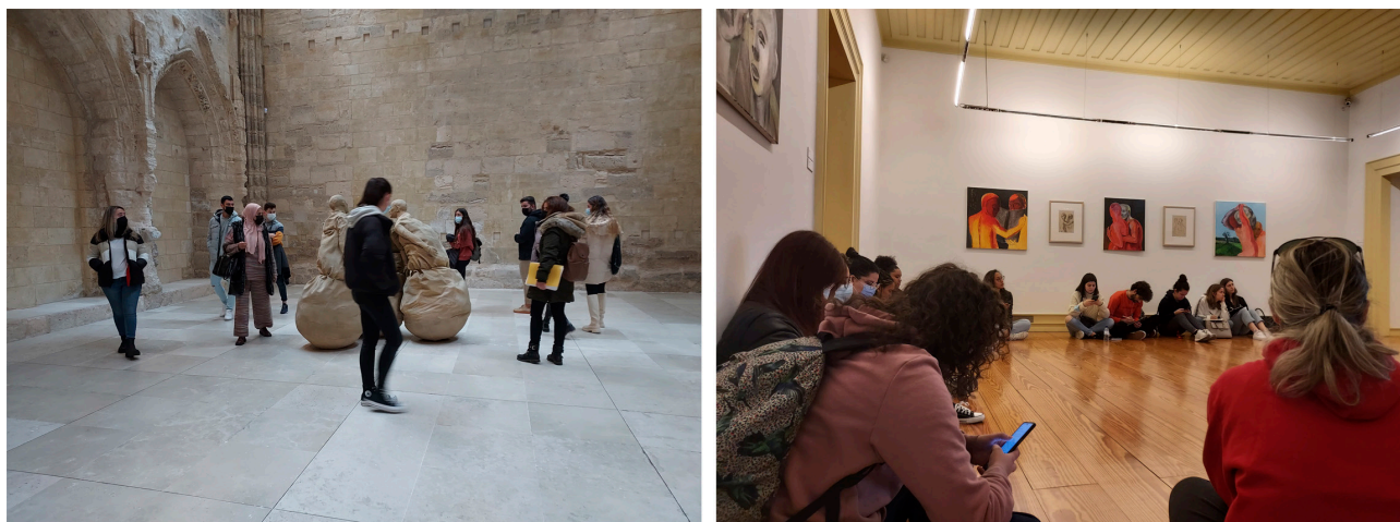
Imágenes 2 y 3. Estudiantes de España y Portugal visitando el Museo Patio Herreriano y Casa Museo Graça Morais.

Convencidos de la necesidad de reducir esa grieta o ruptura con los museos, educar la mirada crítica de los jóvenes hacia las imágenes y la necesidad de una adecuada alfabetización visual, iniciamos en 2021 un grupo de trabajo bajo el paraguas del PID UVaMusEA: un proyecto de colaboración universidad-museo en torno a la Educación Artística (imágenes 2 y 3)