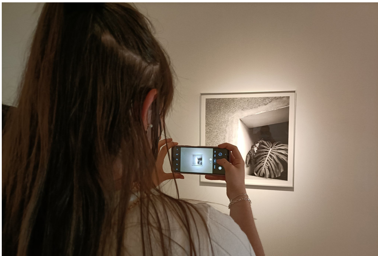
Imagen 1. Reflexión visual. Estudiante fotografiando una de las obras de Carlos Cánovas (Museo Patio Herreriano).

Como espacios educativos de interés para las etapas de educación infantil y primaria, tal y como hemos señalado, resulta abrumadora la desconexión existente entre nuestros estudiantes y la vida cultural de su entorno más cercano. Si sumamos esta situación a la ausencia de especialización en torno a la Didáctica de la Expresión Plástica, Visual y Audiovisual en los planes de los grados de educación, nos situamos frente a un futuro incierto en la formación y sensibilización artística que los futuros maestros y maestras puedan transferir a sus alumnos y alumnas de infantil y primaria.