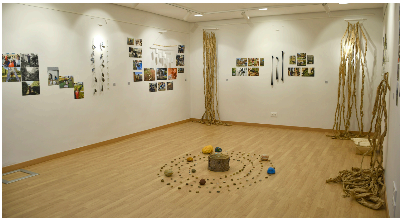
Imagen 10. Montaje final de la exposición Instalaciones Multisensoriales al aire libre en la sala de exposiciones del campus universitario La Yutera.

La exposición se inauguró en sala del campus universitario en febrero de 2023 (imagen 10). Los estudiantes lo presentaron en una rueda de prensa pública ante la comunidad universitaria. Los buenos resultados de esta primera exposición hicieron posible su itinerancia a otros campus universitarios y espacios expositivos y sociales, como El Barco de la Rubia de Valladolid o el Centro Cultural Antigua Cárcel-Lecrác de Palencia.