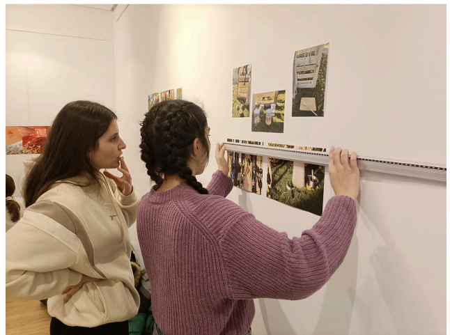
Imagen 6. Niños y niñas interactuando con las instalaciones en el campus universitario La Yutera (Palencia). Imagen 7. Sesión de comisariado educativo en la sala de exposiciones. Imagen 8. Estudiantes en sesión de trabajo para la exposición. Imagen 9. Montaje de la exposición.