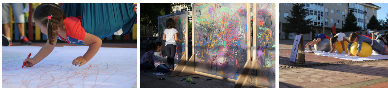
Imagen 1, 2 y 3. Artistas-participantes en el proyecto Maratón do debuxante.

La fotografía como instrumento de documentación y voz, refleja las interacciones, relaciones entre el público, la participación activa, la expresión de ideas, pensamientos, etc. La foto–voz puede interpretarse como el fotoactivismo aplicado como metodología docente (Agra y Mesías, 2007). Es decir, el uso de la imagen como instrumento de expresión y comunicación para construir acciones activistas que nos lleven hacia una participación crítica de los propios docentes para enfocar sus experiencias estéticas y el quehacer cotidiano. El objetivo de la cámara funciona en este caso, como capturador de observaciones y opiniones de lo visual, permitiendo explicar de una manera más eficaz la relación entre docente y alumno (artista–espectador). La fotografía, presente en el mundo cotidiano, estimula la iniciativa para opinar, reflexionar, construir pensamiento, y ofrece un espacio educativo para enseñar y aprender, dirigiendo la investigación hacia el proceso de acción. Cabe resaltar, que la documentación fotográfica facilita la visibilidad de entornos educativos: las escuelas o espacios adaptados a los talleres; los participantes, colaboradores, talleristas, artistas o docentes; y el proceso de acción.