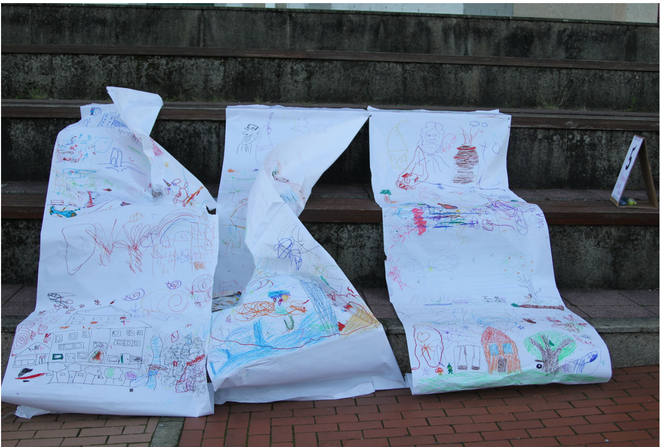
Imagen 10. Algunos resultados de la acción artística

Ofrecemos la configuración del entorno y del participante-espectador, dentro de una ambientación adecuada. Todo lo que le atrae al público será complemento del juego para desarrollar capacidades, motrices, cognitivas y emocionales. El juego se va enriqueciendo a lo largo de tiempo y nunca llega a pararse, sólo cambia de contexto, pensamiento y entorno. El desarrollo de la estrategia de juego aparece constantemente para motivar y transmitir las acciones a partir de las emociones y la capacidad de interpretar lo que escuchamos y las tareas que nos ordenan hacer de una manera divertida. No necesitamos averiguar qué idea se esconde a partir de la palabra juego, ya que llevamos jugando toda nuestra vida y cuando jugamos, lo hacemos para entretenernos, para sentirnos libres.