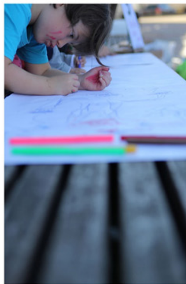
Imagen 4, 5, 6, 7, 8 y 9. Artistas-participantes en el proyecto Maratón do debuxante.