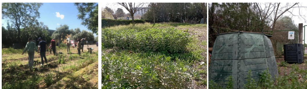
Figura 2. Huerto ecológico universitario comunitario y composteras (dcha.)

El objetivo es que el uso del huerto se realice por estudiantado, profesorado (PDI) y personal de administración y servicios (PAS) de la Facultad de Ciencias de la Educación y Psicología de la Universidad de Córdoba, pero se podría ampliar la oferta al estudiantado del centro intergeneracional de la universidad, constituido por personas mayores de 50 años y también a personal relacionado con la facultad, como puede ser profesorado tutor de prácticas de grados y másteres, implicando así a toda la comunidad educativa y fomentando la convivencia entre estos grupos.