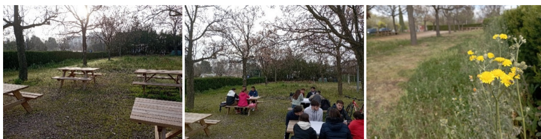
Figura 1. Aula jardín de la facultad y zona de herbáceas anuales (dcha.)

Este jardín se ha dotado de especies autóctonas del monte-matorral mediterráneo que están adaptadas al clima y no necesitan abundancia de agua. Se han plantado distintas especies arbustivas como lavanda, romero, tomillo, durillo y madroño. Además, en lugar de sembrar césped, se han creado zonas basadas en comunidades herbáceas naturales, es decir, en prados sin riego y se han dejado unas zonas sin desbrozar, de forma que puedan crecer y florecer las herbáceas anuales, facilitando así también la diversidad de polinizadores.