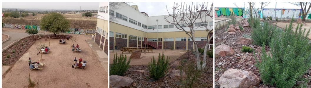
Figura 3. Aula monte mediterráneo con especies autóctonas

Los árboles se han plantado a través de la iniciativa de profesorado y personal de administración y servicios que se ha jubilado y de personas interesadas en participar, que han planteado este emotivo proyecto de dejar como legado una serie de árboles en la facultad.