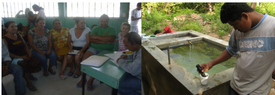
Figura 1: Proceso del PGIRH

Para comprender el aporte que el uso de SIG y en concreto gvSIG Fonsagua ha supuesto es necesario describir brevemente en qué consisten las distintas fases del PGIRH.