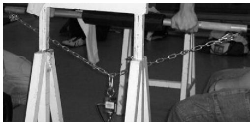
Figura 2. Colocación de la cadena en la célula de carga.

Por el orificio libre de la célula de carga y con la ayuda de un mosquetón se hacía pasar una cadena de 1,5 m que se enganchaba a cada extremo de la barra de aplicación de fuerza (figura 2).