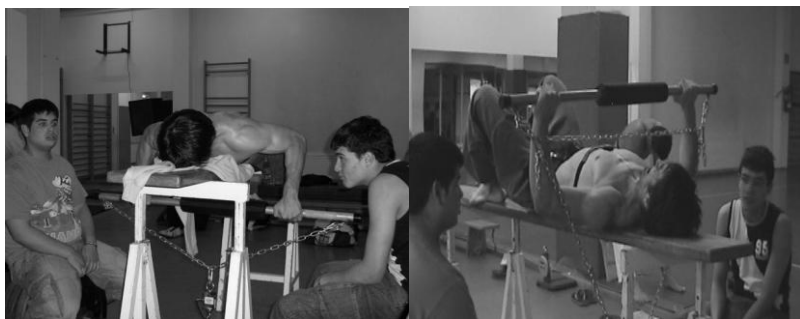
Figura 4. Test de fuerza máxima isométrica en remo tumbado (90°) y press de banca (90°)