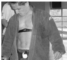
Figura 8. Colocación del monitor de ritmo cardíaco.