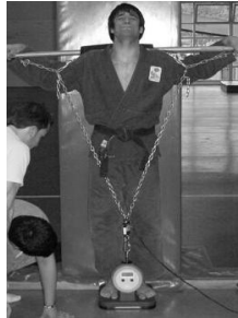
Figura 6. Test de fuerza máxima isométrica en squat 160°.

características en cuanto a las instrucciones que recibe el sujeto y la pretensión mínima requerida son idénticas a las del test de los miembros superiores (figura 6).