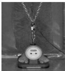
Figura 5. Célula de carga unida al Dinamómetro lumbar Takei T.K.K. 5102 para la realización del squat isométrico 160°