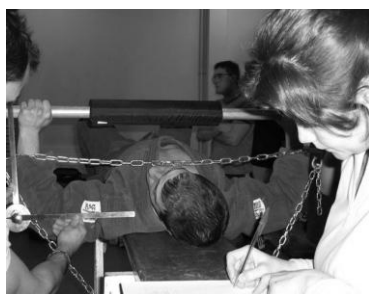
FIGURA 3. Medición del ángulo de 90^\circ con el goniómetro en el test de press de banca

Las instrucciones que se le dan a los sujetos fueron: “aplica tensión tan fuerte y rápido como puedas”. Dichas instrucciones se ajustan a las recomendaciones de Wilson y Murphy (1996) para obtener la producción de fuerza máxima y los valores máximos de la RFD (Rate of Force Development) ó rango de desarrollo de fuerza.