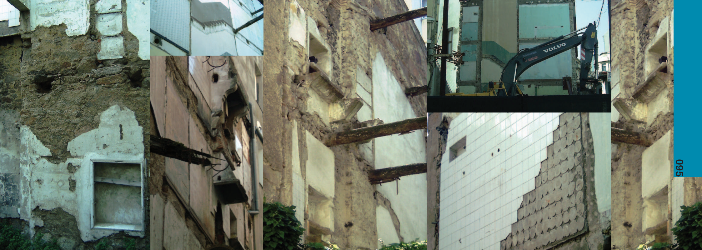
Elementos e texturas que conforman a linguaxe das medianeras. O autor.