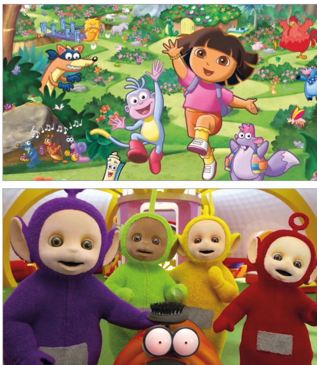
Figura 2. Dora la exploradora y Teletubbies https://www.youtube.com/watch?v=3fp_H05Q4pw https://www.youtube.com/watch?v=Fu869sMw9fI

La emoción es clave para aprender y las historias son un gran activador de zonas cerebrales que consolidan el recuerdo (Mora, 2013). En cualquier caso es necesario apuntar que no todas las narrativas influyen por igual en el aprendizaje, aun cuando se trata de contenidos y estructuras aparentemente similares (Bavelier; Green; Dye, 2010). Investigaciones sobre los efectos de diversos programas educativos determinan que mientras programas como ‘Dora la exploradora’ incrementan las habilidades orales y expresivas en niños de 2 años, el impacto de los ‘Teletubbies’ sobre el aprendizaje de palabras, atención visual y comprensión es negativo (Linebarger; Walker, 2005). La complejidad de los estímulos visuales y auditivos, sumada a programas con pobres modelos de lenguaje y de participación son inadecuados para el aprendizaje (Linebarger; Walker, 2005).