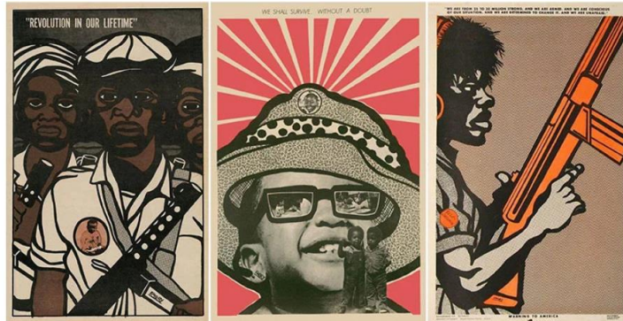
Imágenes 1 - Carteles de Emory Douglas para el Partido: 1) Revolución en nuestro tiempo 2) Sobreviviremos, no cabe duda 3) Somos entre 25 y 30 millones, estamos armados, conscientes de nuestra situación y determinados a cambiarla. Además, no tenemos miedo. Carteles de Emory Douglas para el partido.

los afroamericanos y reformuló la definición de belleza (Adesina). Black is Beautiful fue un movimiento multifacético que aspiraba a elevar el orgullo y la individualidad negros. Hizo hincapié en que todas las personas, independientemente de su edad, deberían abrazar su belleza innata y sentirse realizadas. El movimiento sirvió como un importante recordatorio de que la diversidad debe ser alabada y que la belleza se presenta de muchas formas (Adesina).