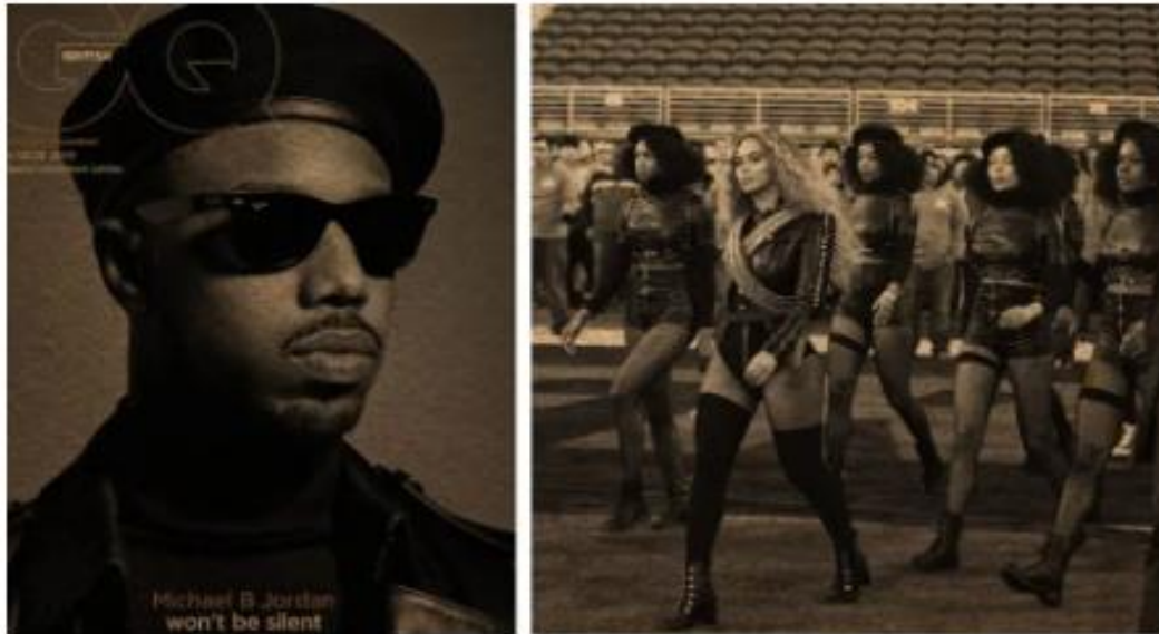
Imagen 3- Michael B. Jordan y Beyonce hacieno uso de códigos de estéticos de las Panteras Negras.

representación. Esto al mismo tiempo que promueve la conciencia y la aceptación cultural.