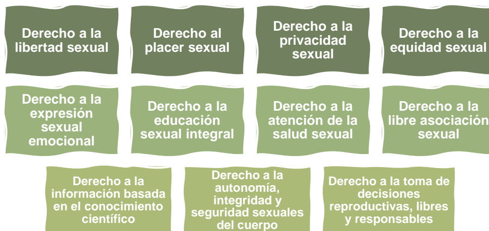
Figura 2: Listado de derechos sexuales. Datos extraídos de la Declaración Universal de los Derechos Sexuales (12).

Con el objetivo de garantizar el desenvolvimiento óptimo y libre de una sexualidad saludable, es fundamental luchar por que estos derechos sean promovidos, defendidos y respetados por toda la sociedad (12).