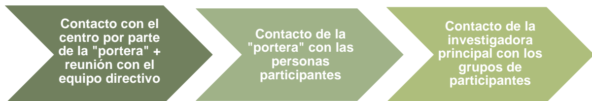
Figura 3: Síntesis de la entrada al campo.

En la Figura 3, se muestra, de manera visual, una síntesis de las etapas que conforman la entrada al campo.