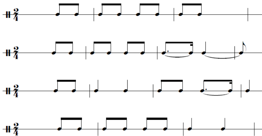
Figura 3. Motivos rítmicos.

Lo mismo ocurre en el verso tres (tercera línea de la figura 3), en el que, tomando como referencia el verso uno, las dos primeras corcheas del primer compás se convierten en dos negras y se vuelve a repetir el fenómeno explicado para el final del verso dos. En el cuarto verso (cuarta línea de la figura 3) volvemos a encontrar el intercambio de dos corcheas por dos negras, pero en este caso en el segundo compás.