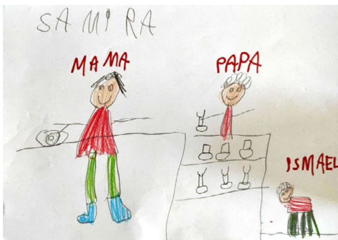
Figura 3. Alumna de 1º curso. Familia nuclear en el hogar donde aparecen elementos materiales (sartén). La alumna está ausente en el dibujo.