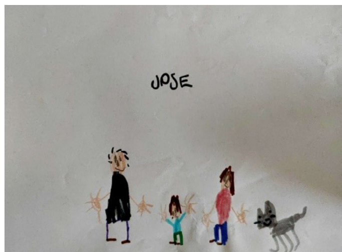
Figura 4. Alumna de 1º curso. Familia nuclear sin determinar el entorno, donde aparecen elementos animales (gato). La alumna se sitúa junto al padre y la madre.