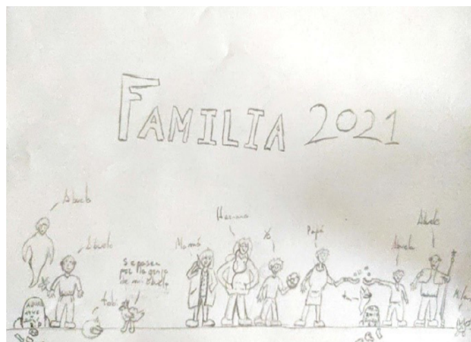
Figura 5. Alumna de 6º curso. Familia nuclear. Adición de elementos familiares que no fueron citados en la entrevista (los abuelos fallecidos).