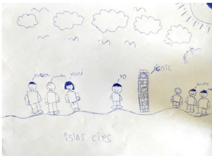
Figura 2. Alumno de 6º curso. Familia nuclear en un espacio público donde aparecen elementos naturales. El alumno está situado de forma independiente.