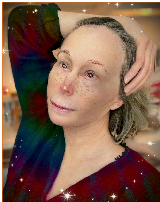
Figura 2. Cindy Sherman (15 de febrero de 2012). Happy Valentine's Day. Let's be optimistic

la técnica y del lenguaje fotográfico a la hora de reapropiarse y reinterpretar los discursos visuales. La propia Sherman participa actualmente en Instagram aplicando a su rostro filtros exagerados que lo deforman digitalmente. Sin embargo, esos personajes que tanto Morimura como Sherman construyen, pretenden aludir a la sociedad de consumo en la que nos encontramos y a la capacidad de transformación de la identidad. Por otro lado, lo que nos encontramos en Instagram de manera más habitual son personalidades ficticias que sus usuarios construyen bajo los cánones sociales y de belleza establecidos para ser, en todos los sentidos, «bien vistos». No son transformaciones críticas, sino formas de adaptarse para encajar, para poder convertirse en productos de consumo atrayentes. Estas personalidades no se comportan igual que en los anuncios televisivos: conocemos sus vidas, hablan desde la intimidad de sus casas y comparten sus pensamientos y aficiones, pero todo ello edulcorado con la mejor de las puestas en escena. Sin necesidad de ser conocedores de la historia de la fotografía, aplican instintivamente recursos escenográficos para enmarcar su narrativa visual, iluminando y «atrezando» sus fotografías gracias a la gran cantidad de información que nos ofrece internet.