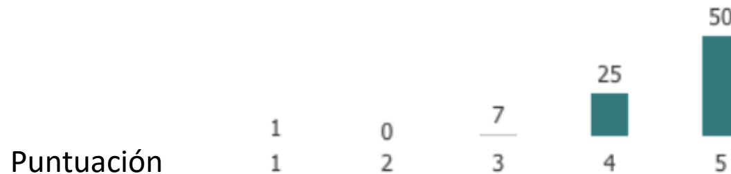
Distribución da puntuación