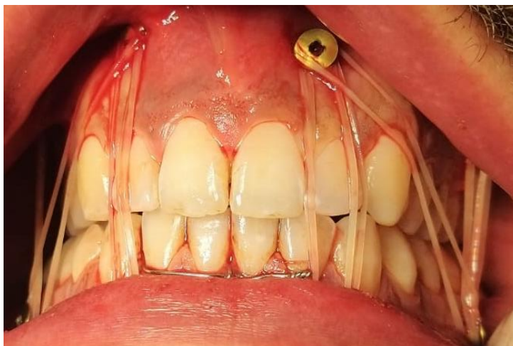
Ilustración 5. Bloqueo intermaxilar, imagen intraoperatoria

En cuanto a las consecuencias de los traumatismos del área maxilofacial, se observa que estos tienen un alto impacto funcional, emocional, estético y económico, incluyendo altos costes en gastos médicos y pérdidas de productividad 16,17 .