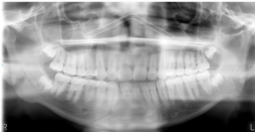
Ilustración 2. Fractura de parasíntesis y ángulo mandibular en OPG

Habitualmente el diagnóstico de estas fracturas se puede hacer mediante la exploración clínica y confirmarlo con radiografías (Rx), especialmente la técnica de radiografía dental u ortopantomografía (OPG); o con la tomografía computerizada (TC) siendo esta el gold standard para el diagnóstico 12 .