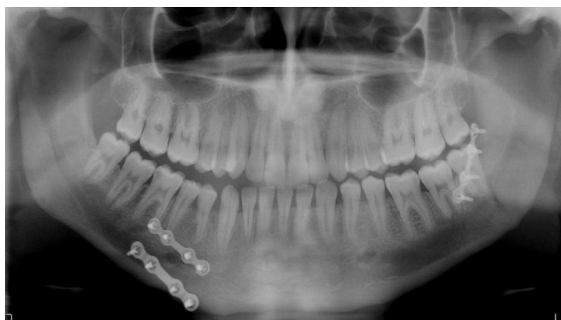
Ilustración 4. Placas de osteosíntesis como tratamiento de doble fractura mandibular

Con respecto al manejo quirúrgico, éste es variado y se puede llevar a cabo bajo anestesia local o general. De esta forma, diferenciamos la reducción cerrada de la fractura (fracturas nasales), la reducción abierta acompañada de osteosíntesis mediante placas de titanio o bloqueos intermaxilares asociados o no a osteosíntesis (fracturas condíleas) 15 .