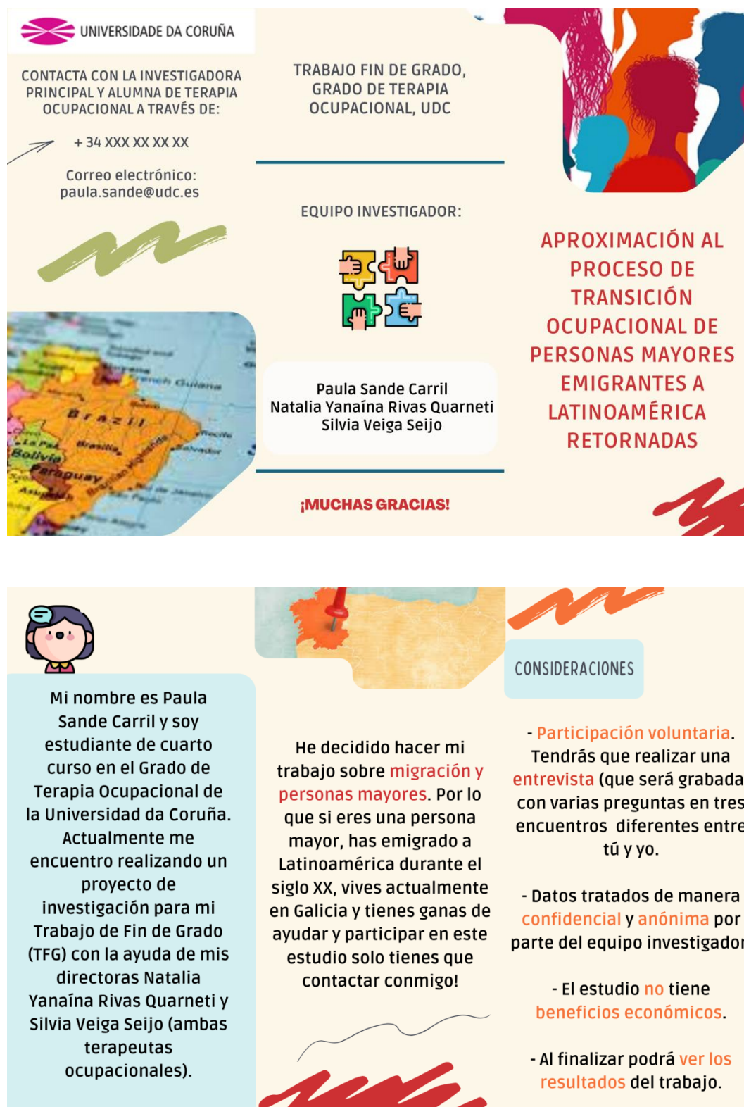
Figura 4. Tríptico para la participación en el estudio