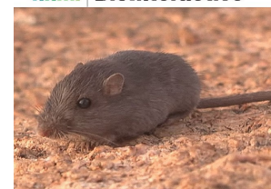
Autoría imagen e información sobre el caso: HHMI BioInteractive