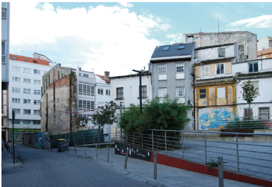
Praza Cantigas da Terra, Atocha Alta.

só cando se quere privatizar algún recurso público de xeito sutil?), como avanzando nas modificacións legais e normativas necesarias para que o uso temporal do abandonado por parte da cidadanía e das administracións públicas sexa o máis natural e sinxelo posible.