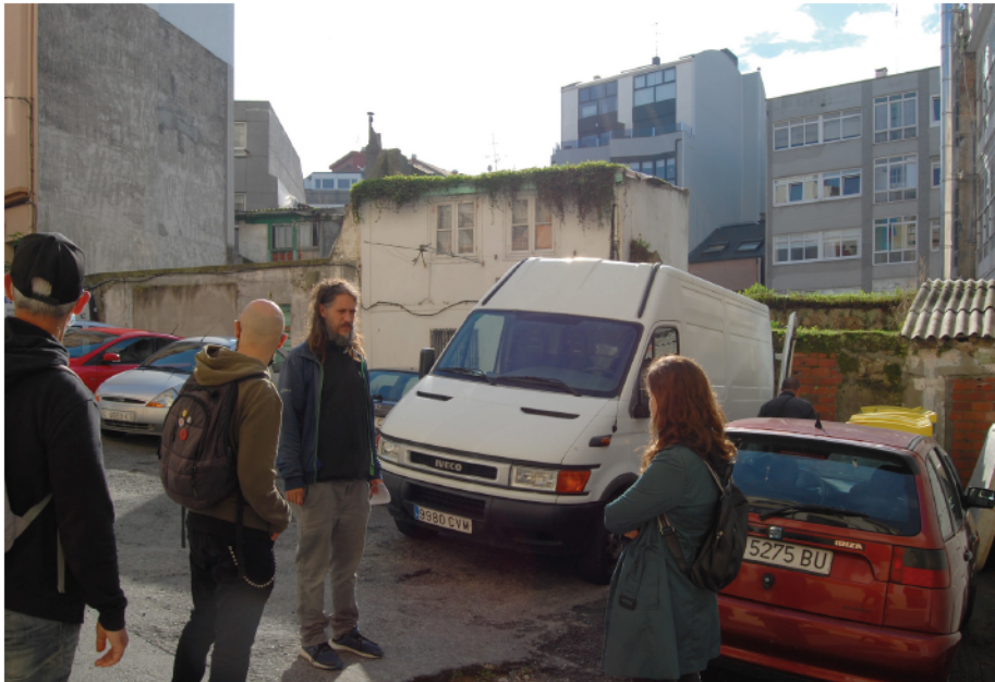
Colexón na rúa Pintor Román Navarro.

- Rúa Pintor Román Navarro. Rúa sen saída (cul-de-sac). Fronte á súa identificación como «tapón urbanístico», neste tipo de tecidos e ámbitos da cidade estas formas urbanas teñen un grande valor en termos de complexidade e diferenza urbana (ao contrario,