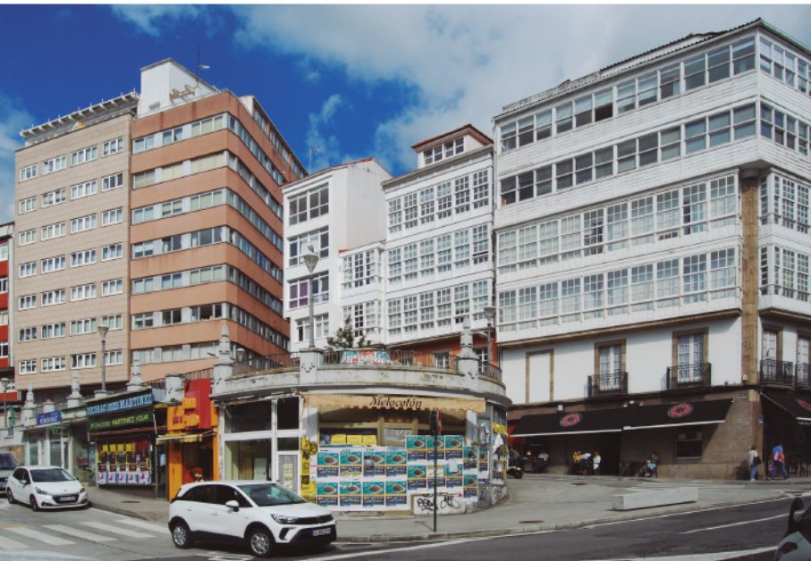
Atala de San Roque ou Lágrima do Campo da Leña.

- Graderío do Campo da Leña (2011). Exemplo de pequeno espazo urbano contemporáneo que é capaz de asumir usos cotiás diversos e actividades colectivas esporádicas xa de certa complexidade.