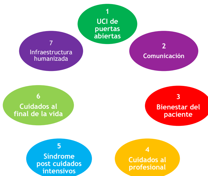
Figura 1. Líneas Estratégicas proyecto HU-CI

Con este nuevo concepto sobre la mesa, nace en 2014 un Proyecto de Investigación internacional “Humanizando los cuidados intensivos” (HU-CI) 8 , cuyo fin es ofrecer un guion de actuación a los profesionales, familias y pacientes y acercar los cuidados intensivos a la población general.