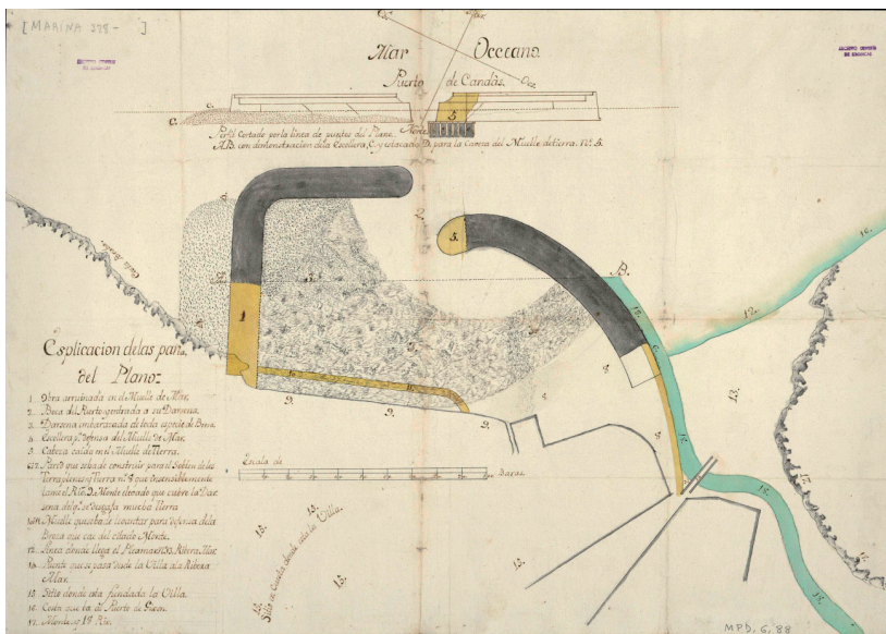
Fig. 5. Puerto de Candás, 1771. Pedro Ignacio de Lizardi. AGS, Mapas, Planos y Dibujos (en adelante MPD), 06,088. Se aprecian que continúan las mismas zonas derruidas y la colmatación del puerto por la acumulación de escombros y la acción del oleaje y las mareas.

Someruelos dirige a Arriaga el 28 de septiembre un extenso informe que es una exacta radiografía del estado de los arbitrios asturianos y su aplicación a las obras en los puertos. Se aprueba por la Corona la reparación y se informa al regente que saque a subasta pública la obra conforme al proyecto de Lizardi, que el 12 de diciembre fue informado positivamente por Jorge Juan y Santacilia, aunque juzgó “regular” el presupuesto (AGS, SM, leg. 378). Si los arbitrios de Candás no fueran suficientes, los vecinos podrían proponer otros, pero en modo alguno debían ser extensivos a otras localidades, ya que debían recaer exclusivamente sobre Candás. Todo está encauzado, pero ese diciembre los temporales azotaron la villa. Parecía que la naturaleza se obstinaba en subrayar su protagonismo (Archivo Municipal del Ayuntamiento de Carreño, oficio del gremio de mareantes al ayuntamiento de Carreño, 26 de diciembre de 1771).