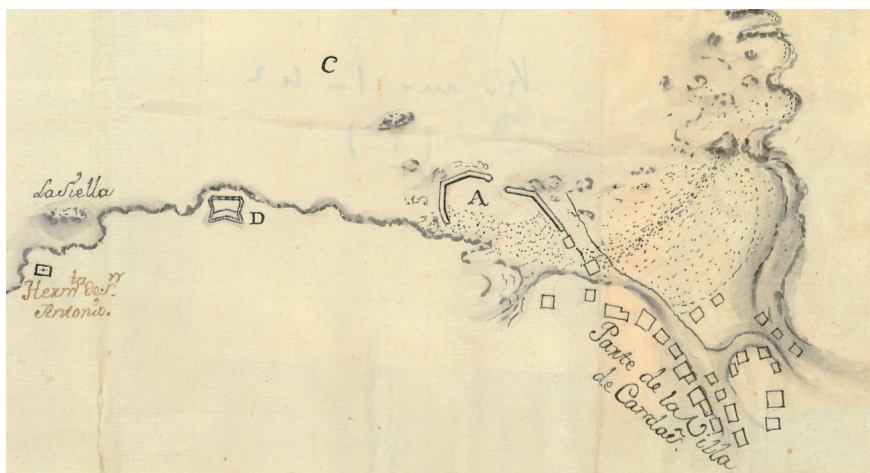
Fig. 4. Demostración de la rada y puerto de Candás en el principado de Asturias, s.f. (1763). CAGMM, O-01-02.

muelle aunque en parte arruinado; parece tratan sus vecinos de su recomposición” (CAGMM, O-01/02 y O-01/03, leyenda A). Una explicación a su situación es que sí fuera restaurado (han pasado tres décadas desde los préstamos), pero que una vez más el océano hubiera triunfado sobre el hombre.