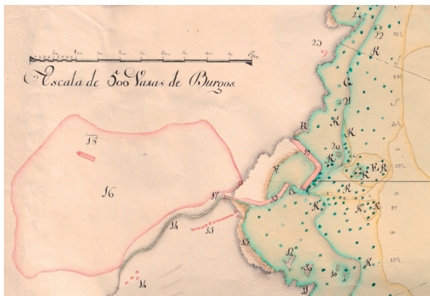
Fig. 6. Plano de la concha de Candás, 1785. MNM, E-35-11. Detalle. 19. Muelles de la dársena.

Ahora bien, los trabajos no habían terminado, ya sea porque la dársena no estaba totalmente limpia o por desperfectos provocados por los temporales, pues hay documentación de los años 1787 (AHPP, caja 2.228, Candás, 9 de enero de 1787, ante Bernardo Prendes Hevia) y 1789 (tres escrituras de poder otorgadas por el gremio del mar a favor de Lorenzo Pérez Sierra, para asuntos relacionados con la obra de reparación del muelle; AHPP, caja 2.228, 22 de febrero, 26 de abril, 10 de junio de 1789, ante Bernardo Prendes Hevia) que son una prueba de que Candás seguía luchando por disponer de un puerto. El siglo concluye con los dos muelles en pie, pero el transcurso del tiempo, es decir, la acción del mar, les afectó y comenzaron a deteriorarse. Tras reiteradas y persistentes quejas y reclamaciones de ayuda, la mediación de dos diputados, Felipe de Canga-Argüelles y Ventades en 1849 y Andrés de Capua y Lanza en 1862, los recursos estatales llegarán y se reedificarán los muelles, se limpiará la dársena y se restaurará el malecón.