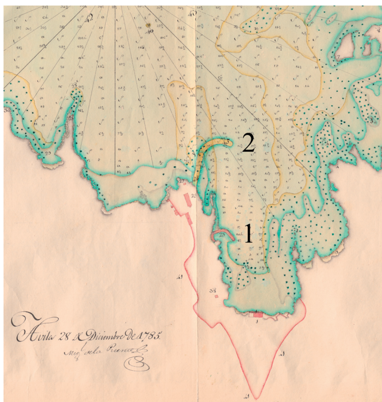
Fig. 3. Plano de la concha de Luanco, 1785. M.N.M., E-36-9. Detalle. 1. Muelle existente. 2. Muelle proyectado.

cabeza del muelle había desplomados y arruinados once pies de largo por quince de alto... al otro lado de dicha abertura y hacia la parte de la iglesia de dicha villa se hallan otros quince pies también desplomados”. En total, se habían venido abajo cuarenta y un pies de largo con quince pies de alto. El maestro recomienda comenzar lo antes posible e intervenir desde los cimientos, pues de otro modo el conjunto amenaza ruina, singularmente la cabeza del muelle. La urgencia viene determinada por el deseo de aprovechar los meses de verano, pues en caso contrario el destrozo será mucho mayor tras el paso del invierno, lo que además de impedir el uso del muelle para cualquier tipo de embarcación, elevará el coste y la complejidad de las obras. Lo único que hay que reedificar totalmente es el frente hacia la parte del mar, donde se deben emplear sillares, aprovechando aquellos que sean útiles de los derruidos para economizar. Incluso detalla cómo se debe proceder técnicamente (AGS, SM, leg. 385).