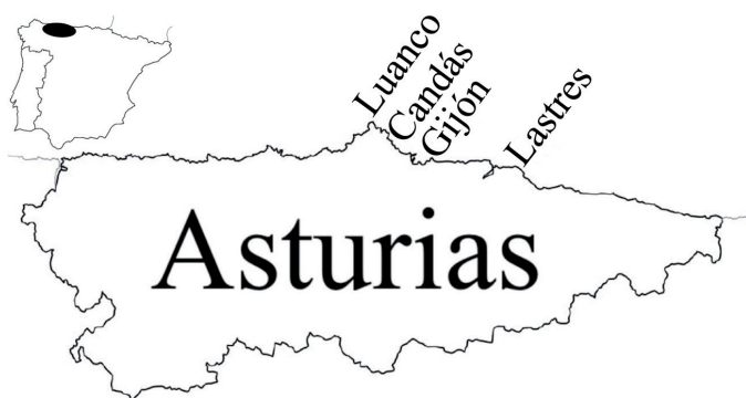
Fig. 2. Ubicación de Asturias en el norte de España. Localización de los puertos de Luanco, Candás, Gijón y Lastres en Asturias. Elaboración propia.

Las causas que explican el declive y despoblación de estos puertos son de